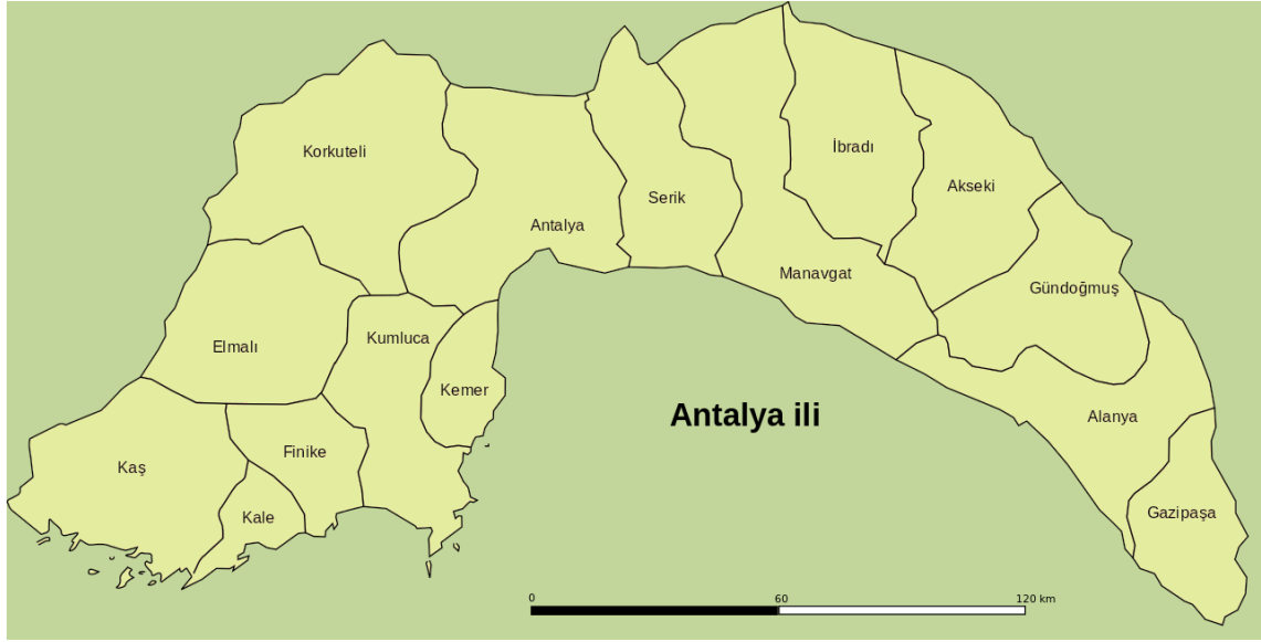
Şekil 2.1. Antalya ili haritası