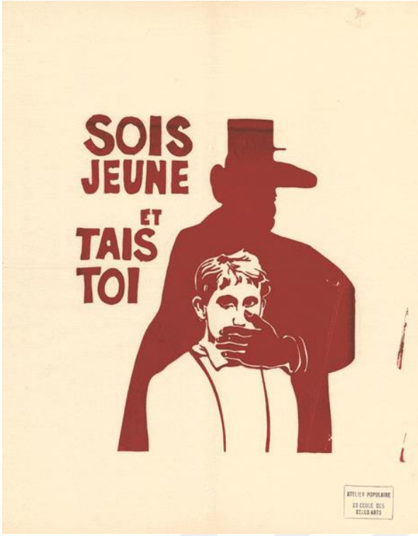
(Genç ol ve sus!)