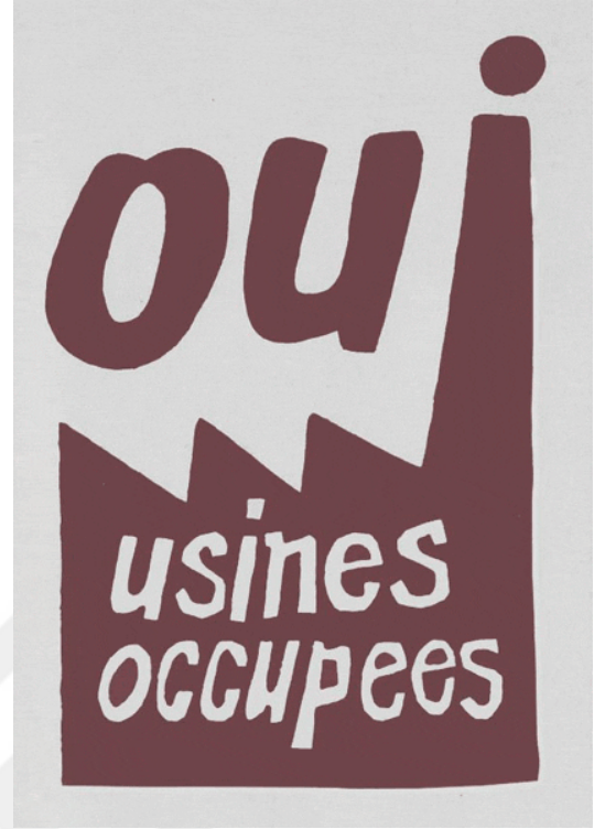
(Fabrika işgallerine evet!)