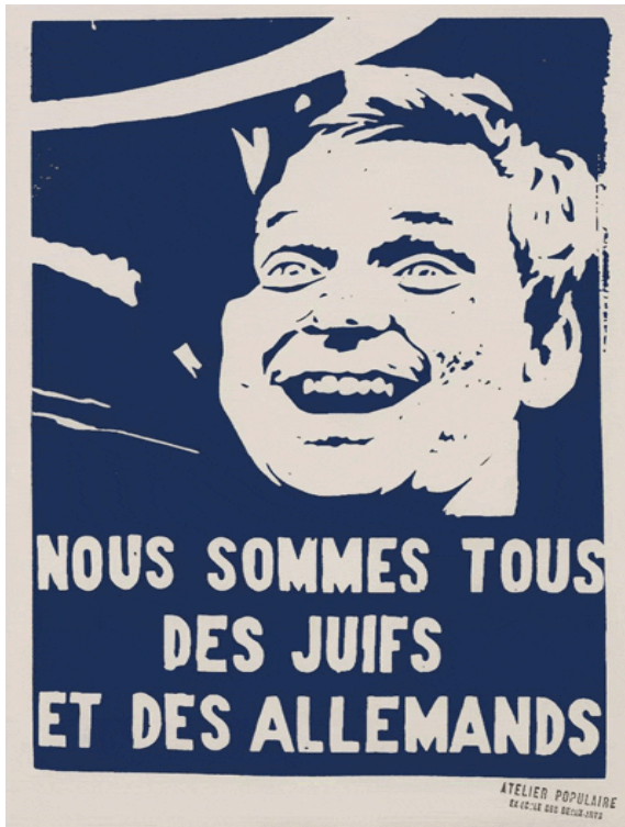
(Hepimiz Yahudi ve Almanız)