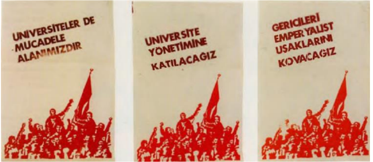
Kaynak: Aysan, 2013: 146.