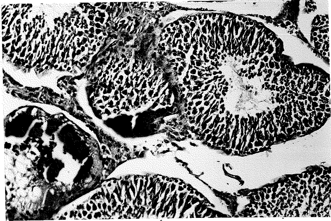
Resim 4. Fokal nodüler leydig hücre hiperplazisi ve kalsifikasyon.