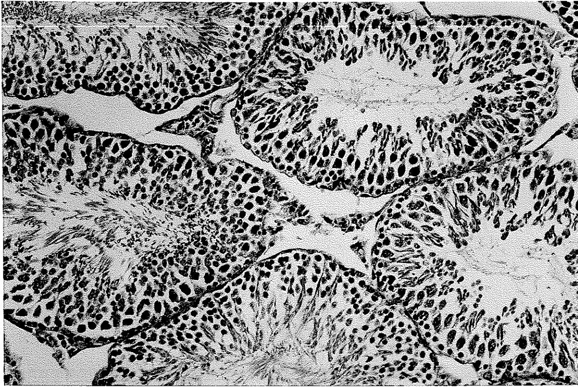
Resim 2. Normal seminifer tbls.