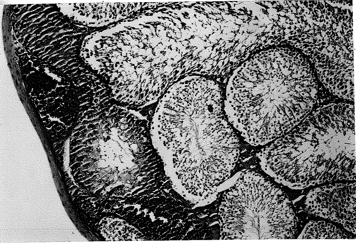
Resim 3. Konjesyon ve nekroz.