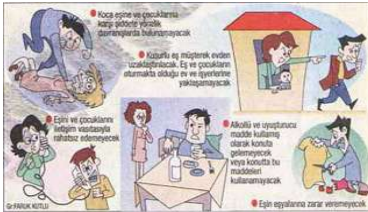
Resim 3.15. Dayakçı Koca Yandı!

diğer eliyle de yumruk atarken gösterilmiştir. Diğer 3 resimde de aynı şekilde şiddet ile kadın arasındaki bağlantı yeniden üretilmiştir. Kullanılan resimler, ne başlıkla ne de haber içeriğiyle bir bütünlük sağlamamaktadır. Görseller, okuyucunun üzerinde, haber metninden daha çok etkili olmaktadır. Bu sebepten dolayı, etik kurallara mutlaka dikkat edilmeli, sırf sansasyon yaratmak için kamuoyunu olumsuz etkileyecek görseller kullanılmamalıdır. Gazetenin, şiddeti bu şekilde görselleştirmiş olması, kanunla zıt bir şekilde, şiddet söylemlerinin yeniden üretilmesine neden olmuştur. Kullandıkları görsel, mevcut ataerkil yapıyı pekiştirmeye hizmet eden bir bakış açısı sunmaktadır. Dursun'un da belirttiği gibi, yirminci yüzyıldan itibaren, medya organlarının şiddetin artmasındaki kilit nokta olduğu görüşü sürekli tartışılmalıdır 282 . Bu tartışmalarda, medyada kullanılan şiddet temsillerinin, saldırganlığı olağan ve hoş görülmesine, şiddetle sorunların çözülebileceği algının yaratılmasına vb. etkisi olduğuna dikkat çekilmektedir 283 .