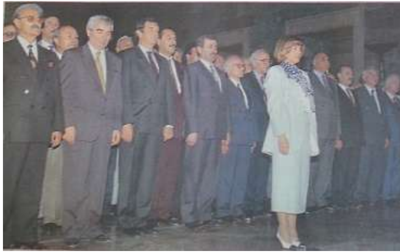
Resim 3.14. Erken Seçim Rüzgarı

somut göstergesidir 240 . Siyasi yapılanmaya genel olarak bakıldığında, kadınlara karar verme mekanizmalarında yer verilmemektedir 241 . Kadınlar bu yapılanmada daha çok, üyesi oldukları partiye kaynak sağlamak ve seçim dönemlerinde kadın seçmenin oyunu toplamak amacıyla görevlendirilmektedir. Minibaş'a göre, ataerkil sistemin hakim olduğu toplumdaki diğer alanlarda olduğu gibi siyasette de kadınlar, erkeklerin belirlediği alan içinde faaliyette bulunmaktadır 242 . Her ne kadar Çiller, kendi dönemi içinde sınırları aşmış başbakan olmuşsa da, ileriki yıllara etkisini devam ettirememiştir.