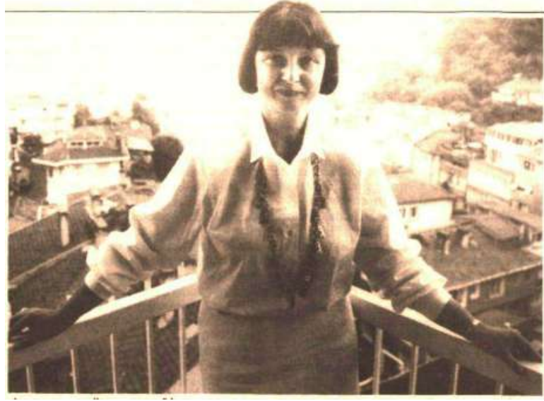
Resim 3.5. Türkiye’de İlk Kadın Vali

07.07.1991 – Cumhuriyet Gazetesi – İstanbul Beyazıt Devlet Kütüphanesi Arşivi