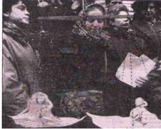
Resim 3.1. İffet Terazisi

İffet terazisi: Sirkeci'deki Büyük Postane önünde toplanan bir grup kadının öfkeli protestosunu görenleri ne olduğunu merak edip yavaş yavaş kalabalığa yaklaşınca, bir hanımın elindeki teraziyeye merakla baktılar. Teraziyeye iki minik kadın maketini yerleştiren hanımın, Anayasa Mahkemesi'ni eleştirdiğini anlayanlar, ilginç protestoyu sonuna kadar izlediler.