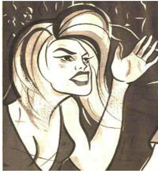
Resim 3.20. Erkeğe de Yoksulluk Nafakası

Haberde on madde bu şekilde, önce eski sonra yeni madde verilerek yorumlanmıştır. Yorumlar da tıpkı maddeler gibi kadın lehine olduğu yönünde yorumlar yapılmıştır. Her maddeye bu kadar yer verilmesiyle, okuyucunun konu hakkında geniş bilgiye sahip olması sağlanmıştır. Haberin görselinde (Resim 3.20.) ise, kızgın bir kadın figürü verilmiştir. Bu görsel, başlıktaki erkeğe nafaka maddesiyle bağdaştırılmıştır. Pek çok maddesiyle toplumda kadın erkek eşitliğini sağlayacak olan yeni Anayasa’nın tanıtımı, diğer gazeteler tarafından kadının konumunu güçlendiren, özgürlüğünü ve eşitliğini sağlayan bir gelişme olduğuna vurgu yapılmasına rağmen, Cumhuriyet gazetesi bu haberinde, hem başlıkta hem de görselde erkekler lehine olan maddeyi ön plana çıkarmayı tercih etmiştir.