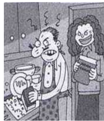
Resim 3.18. Artık Daha Medeniyiz

http://gazetearsivi.milliyet.com.tr/GununYayinlari/MBzn0pDNIJZXAb4ygn5ERw_x3D_x3D_