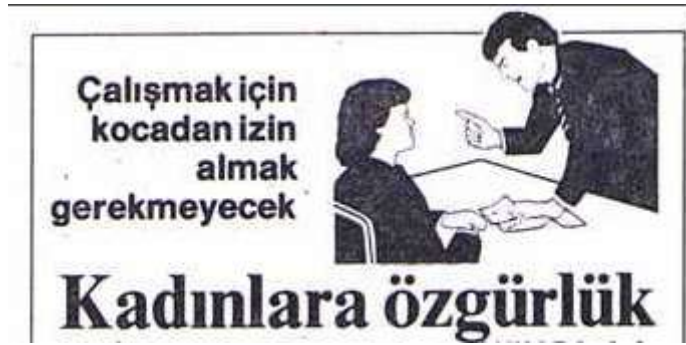
Resim 3.2. Kadınlara Özgürlük