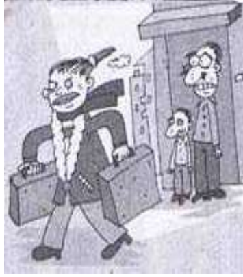
Resim 3.19. Artık Daha Medeniyiz