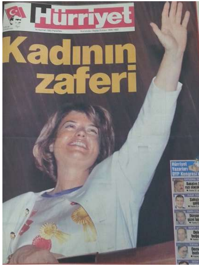
Resim 3.12. Kadının Zaferi

14.06.1993