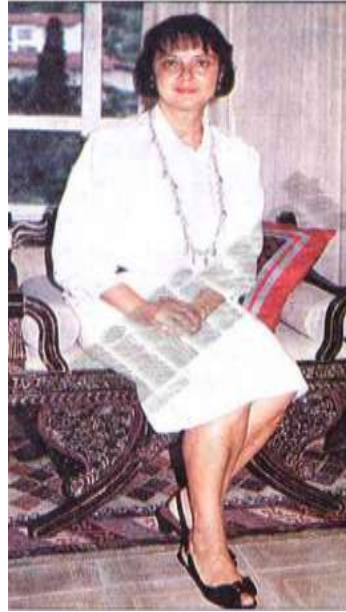
Resim 3.3. Lale Hanım İlk Kadın Vali

Callamard'ın da belirttiği gibi, siyasi kimlikleri değil, anne ve eş kimlikleri ön plana çıkarılmaktadır 209 .