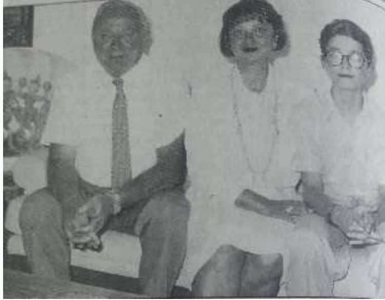
Resim 3.8. Vali Hanım

07.07.1991 – Hürriyet Gazetesi – İstanbul Beyazıt Devlet Kütüphanesi Arşivi