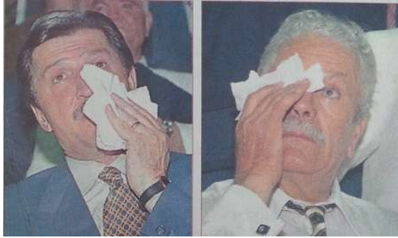
Resim 3.13. Toptan: İki Erkek, Bir Kadınla Baş Edemedik

Gazetenin görüşü bir yana, Sezgin ve Toptan’ın kendi aralarındaki bu konuşma, Mesut Yılmaz’ın ‘kadın siyasetçiye’ bakış açısıyla örtüşmektedir. Altındal’a göre, Türkiye’de etkili ve keskin bir ideoloji olan ve siyaseti sadece erkekle bütünleştiren ataerkil yapı sorgulanmadıkça, kadınların siyasi alanda var olmalarından ve cinsiyet eşitliğini sağlayabilecek politikalardan bahsetmek kısa vadede gerçi görünmemektedir 237 .