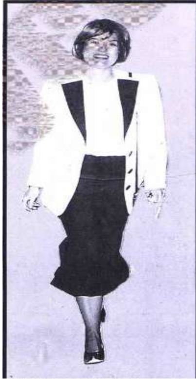
Resim 3.9. Çiller'den 'Ya Hep, Ya Hiç'