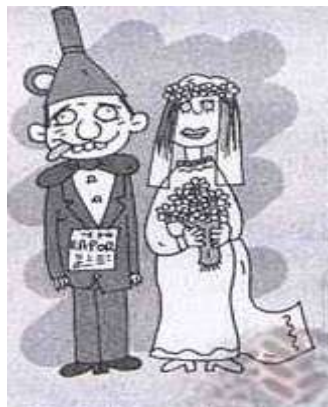
Resim 3.17. Artık Daha Medeniyiz