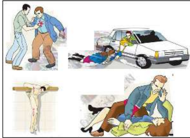
Resim 3.21. Hayatımıza Yeni Düzen