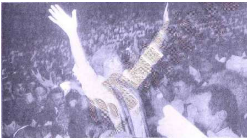
Resim 3.10. Kabineye Çiller Damgası

12. sayfadaki haberlerin başında, “Kabineye Çiller Damgası” başlıklı haber yer alıyor. Çiller’in kolları havada parti üyelerini selamlayan bir fotoğrafı (Resim 3.10.) verilmiş olup haber ayrıntısında kabinede kalacak ve gidecek olan bakanların listesi verilmiştir.