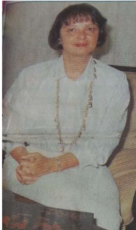
Resim 3.7. Vali Hanım

ilk kez bir kadın vali atandı' ayrıntıları ile olayın Türkiye için ve kadınlar için gurur verici olduğu vurgulanmış ve aynı şekilde bu duruma destek oldukları açık şekilde gösterilmiştir. Diğer gazetelerde de olduğu gibi Hürriyet'te de, Aytaman'ın başarılı kariyer hayatının yanında, aynı zamanda bir anne ve eş oluşu da konu edilmektedir. Mine Bek'in de belirttiği gibi, yayın organları, başarılı kadın temsilcilerini kamuoyuna "olağanüstü, süper kadın" olarak lanse etmektedir. Aytaman gibi iş hayatında güçlü, başarılı ve aynı zamanda aile hayatını da dört dörtlük yürüten kadın figürleri, istisna örnekler oldukları her anlamda hissettirilmektedir 217 . Türkiye'de erkek siyasetçilerin özel yaşantısı genel olarak kamuoyuna yansıtılmazken, kadın siyasetçilerin erkek rakiplerinden farklı ölçütler içerisinde değerlendirilmeleri söz konusudur 218 .