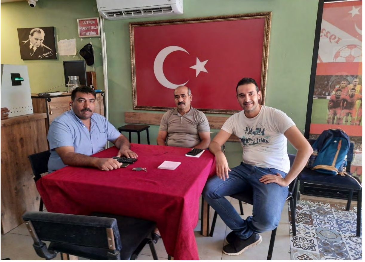
Kaynak: Alan Araştırması Kapsamında Zeytinköy’de Abdallar Tarafından İşletilen Bir Kahvehaneyi Ziyaret, 22.10.2022

Antalya Abdallarını ekonomik yaşamda üretici bir aktör haline getiren en önemli unsur ise göçebelikten yerleşik yaşama geçiş olmuştur. Yerleşik yaşama geçişle birlikte Antalya Abdalları düzenli bir gelire, iş ve meslek kollarına sahip olduklarını belirtmişlerdir. Görüşülen Abdallar iktisadi yaşamları başta olmak üzere eğitim, boş zamanları değerlendirme faaliyetleri ve inanç gibi kurumlarında yapısal değişiklikler tecrübe ettiklerini belirtmişlerdir (A1, A2, A4, A5, A10, A11, A12, A15, A16, A18, A19, A23, A27, A29, A30, A33, A34, A42, A49).