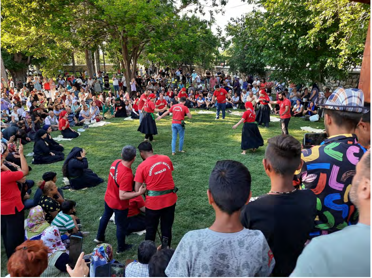
Kaynak: 24-25 Haziran 2022 Antalya (Elmalı), Abdal Musa Anma Etkinlikleri Kapsamında Yapılan Cem Töreninden Bir Kare

Abdal dedesi ile yapılan görüşmelerde gizli bir yanlarının bulunmadığı, ibadetleri ve kapılarının tüm insanlara açık olduğu belirtilmiştir. Eski zamanlardan beri anlatıla gelen bir takım söylenti ve dedikoduların sadece Alevi-Bektaşî geleneğini kötölemek üzere kullanıldığı değerlendirilmiştir (A2). Antalya Abdallarında on iki imamı temsilen on iki farklı görevlinin var olamadığı bir ortamda cem töreni yapılamamaktadır. Küsler, dargınlar, kavgalıların olduğu bir ortamda da cem töreni gerçekleşmemektedir. Antalya'nın farklı yerlerinde yaşamlarını sürdüren Abdalların neredeyse tamamının birbiriyle akraba oldukları, Finike'deki Abdalların Manavgat Abdallarının bazı yaşlı kimselerinin isimlerini sayabildikleri ve gayet iyi ilişkiler kurdukları gözlemlenmiştir.