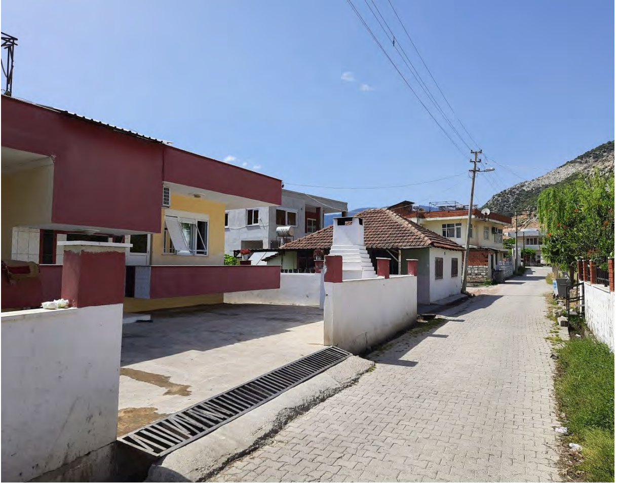
Kaynak: Alan Araştırması Kapsamında Finike Yuvalı'dan Bir Kare, 08.09.2022

“Biz göçebe insanlarız, ayağımızın, elimizin toprağa değmesi gerek. Bu yüzden apartmanda kolayca yaşayamayız. Toplum tarafından bir önyargı var hakkımızda. Abdalların inancından ve Çingenelerle karıştırılmasından kaynaklanıyor diye düşünüyorum. Bir de çok eski zamanlarda Aleviler, Kızılbaş olarak bilinirmiş tarihi kaynaklarda. Kızılbaşlar Osmanlı döneminde kıyıya uğramamak için saklanabilecekleri orman ve dağlara yakın yerlerde yaşarlarmış. Alevi inancına sahip bir toplum olarak Abdallarda güven içinde yaşamak için bir arada yaşama kültürü geliştirmişler. Göçebe zamanlarında da yerleşik yaşamlarında da bu beraberlik korunmuş. Halen Serik'te yaşayan Abdallar olarak da bizim için geçerli bu.” (A39).