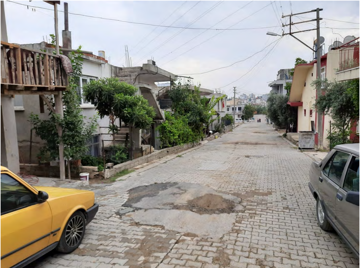
Resim 3: Kökez Mahallesi'nden Bir Görünüm

Abdalların Antalya'da ikamet ettikleri yerleşkelerden birisi de Serik İlçesi Kökez Mahallesi'dir. Serik Merkez Mahallesi ile sınır olan bu yerleşkede sözlü kaynakların verdiği bilgiler doğrultusunda yaklaşık 200 Abdal hanesinin, 650-800 nüfusun yer aldığı değerlendirilmektedir. Çoğunlukla orta yaş ve üstü Abdalların çalgıcılıkla geçimlerini temin ettiği yerleşkede Abdallar; belediye temizlik ve mezarlık hizmetleri, oto boyacılığı, inşaatta amelelik, geçici tarım işçiliği, turizm otelcilik sektöründe temizlik görevlisi, kat görevlisi, otopark bekçiliği, seracılık ve ayakkabı boyacılığı gibi işlerle meşgul olabilmektedir. Her haneden bir müzik enstrümanı çalabilen kişiler yetiştirmeyi amaçlayan mahalle sakinleri, kış mevsiminde düğün ve eğlence işleri az olduğundan kış mevsimlerinde ekonomik sorunlar yaşayabilmektedir. Kökez Mahallesi'nde yaşayan Abdalların çalışma yaş grubu 18-60 olarak ifade edilebilir.