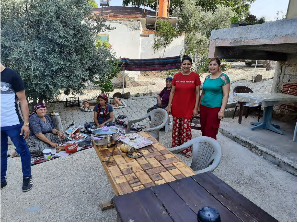
Kaynak: Kurban Bayramı ilk günü Serik'te Yaşayan Abdallarla Bayram, 09.07.2022

“Kurban kesiminin dede tarafından yapılarak hayır duasının yapılması gerekir. Alevilik inancında kurban kutsaldır. Kesilecek kurbanı Sünnilerin elinin dahi değmemesi gerekirdi ama o adetler ve gelenekler maalesef eskide kaldı. Ölülerimizi camii imamına ykatmak zorunda kalıyoruz, kurbanlarımızı dede yerine aramızdaki en yaşlı erkeklerle kestiriyoruz. Genç nesil kurban kesme işinden hiç anlamıyor. Yavaşça geleneklerimizi, kültürümüzü kaybetmeye başladık diyebilirim. Bu bizim için büyük bir utanç biliyor musun? Kurban kesmeyi dahi, deri yüzmeyi dahi bilmeyen Abdal olur mu hiç? Yeni nesil çok farklı. Benim damat var Ü. Kurban keserken yüzünü öteki tarafa çeviriyor, kızdım kendisine. Sen nasıl Abdalsın dedim. Kan çekiyormuş, dayanamıyorum diyor. Abdal geleneğinde evin erkeği kurbanını keser, derisini yüzer ve parçalara ayırır. Ne hikmetse yeni nesil çok acemi, şehirde büyüyorlar. Teknoloji, iletişim, şehir hayatı onları kendi kültüründen, alışkanlıklarından iyice uzaklaştırıyor.” (A5).