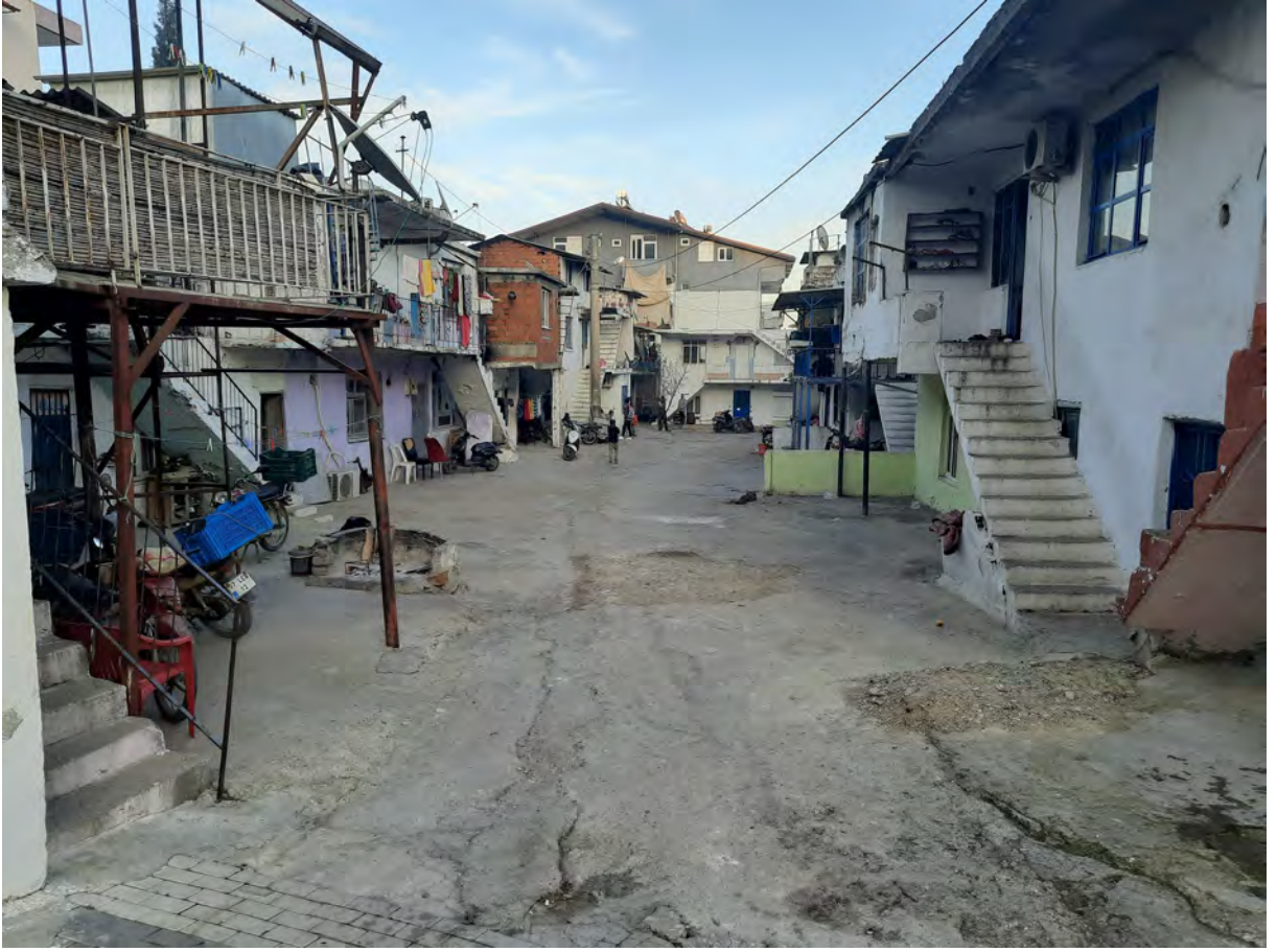
Resim 5: Çayyazı Mahallesi Sokak Arasından Bir Kare

Grup içi evlilik yapılarının egemen olduğu Bereketli Abdallar, tek eşli bir evlilik yapısına sahiptirler. Genel olarak iki ya da üç çocuklu aile yapılarına sahip Abdallar, grup içi aidiyet ve mensubiyet duyguları güçlü bir topluluktur. Eğitim düzeyi genel olarak düşük olan Bereket Mahallesi'nde yaşayan Abdalların, teknik bilgi ve beceri gerektiren iş kollarında istihdam olmadıkları söylenebilir.