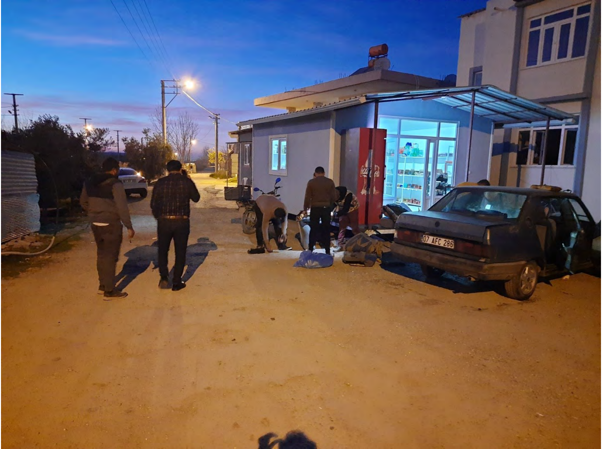
Resim 6: Aşağı Işıklar Mahallesi'nden Bir Görünüm

Genellikle yeni inşa edilmiş, tek ya da iki katlı tapulu olan bu evler modern bir dış görünüme sahiptir. Aşağı Işıklar Mahallesi'nde yaşayan Abdalların sosyalleşebilecekleri bir alan, kurum ya da mekân yoktur. Mahallede kafeterya, kahvehane, cemevi ya da cemevinde sorumlu bir dede bulunmamaktadır. Karayağmurlu Ocağı'na bağlı olan Abdallar, cemevi olmadığı için düzenli ibadet edemediklerini hatta senede bir yapılan görgü cemleri için belediyeden çadır temin ettiklerini ve zemin kötü olduğu için sorun yaşadıklarını belirtmişlerdir. Mahalle'de sadece bir market bulunmakta olup, bölgede yaşayan Abdallar alışveriş merkezlerinden alış veriş etmektense kendi aralarında bir market açmayı uygun bulmuşlardır. Bölgede yaşayan Abdalların büyük kısmı Manavgat Belediyesi'nde temizlik işleri, cenaze ve mezarlık işlerinde istihdam olabilmektedir. Kadınlar ise Manavgat oteller