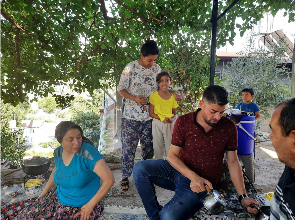
Kaynak: Alan Araştırması Sırasında Antalya Serik'te Evlerinin Bahçesinde Komşularıyla Çay İçen Abdallarla Birlikte, 22.10.2022

Serik'te yaşayan Abdalların yaşadıkları mekân ve çevrenin onların boş zamanlarını değerlendirme faaliyetleri üzerinde etkili olduğu görülmektedir. Ayrıca güne erken başlayan Abdalların oldukça üretken, çalışkan ve çalışmaya istekli oldukları gözlemlenmiştir. Yardımlaşma ve grup dayanışmasının yüksek olduğu Abdallar, türbe ziyareti, avlanma ve piknik gibi etkinliklere birlikte katılmaya hassasiyet göstermektedirler. Piknik ve gezi gibi faaliyetlere beraber katılan Abdalların Sünni arkadaşlarıyla pikniğe gitmedikleri, genelde kendi grupları içerisinde insanlarla daha sağlıklı diyalog kurdukları görülmüştür.