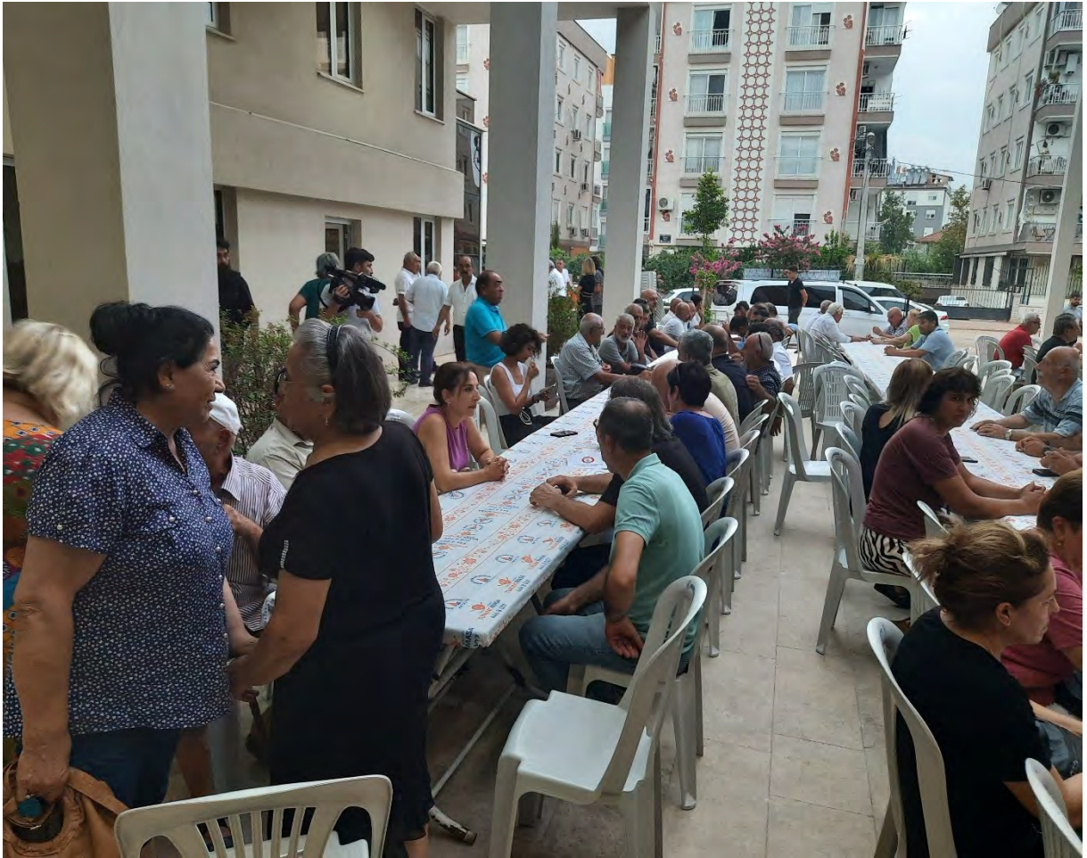
Kaynak: Antalya Zeytinköy Cemevi Avlusunda, Muharrem Ayı Etkinlikleri Kapsamında Muratpaşa Belediyesi İftar Yemeği, 11.08.2022

Araştırmacı, Muharrem Ayı etkinlikleri kapsamında 30 Temmuz-12 Ağustos 2022 tarihleri arasında Zeytinköy Cemevinde yapılan matem ve yaslara katılmıştır. Yapılan gözlemlerde Abdalların lokma adını verdikleri iftar programları düzenlenmiştir. Bu programlara ve sonrasında düzenlenen Hz. Hüseyin ve Kerbela şehitlerini anma