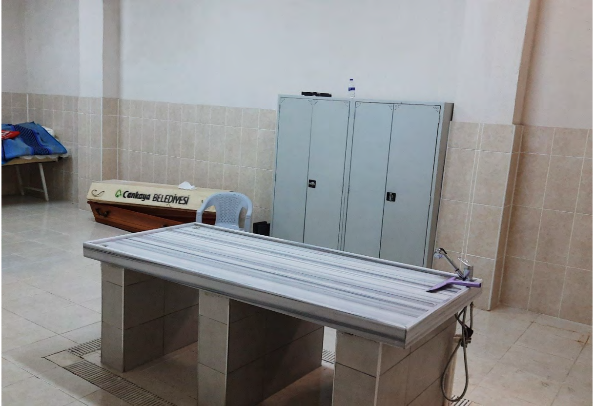
Kaynak: Antalya Zeytinköy Cemevinin Altında Bulunan Morg Odasında Ölülerini Yıkama Yeri

Finike Yuvalı Mahallesi ‘nde mezarlık ve defin işlemlerine önem veren Abdallar, mezarlık tahsis etme konusunda belediye ile sorun yaşadıklarını belirtmişlerdir. Ayrıca yeni tahsis edilen arazinin şartlarının defin işlemleri için uygun olmadığını ifade etmişlerdir. Serik’te Gebiz Mahallesi ve Merkez Mahalle’de yaşayan Abdalların da aynı şekilde Abdalların gömülebildiği ayrı mezarlıkları mevcuttur. Bu mezarlıklara Alevilik inancına sahip vefat etmiş kimseler defnedilebilirken mezarlıkların üstünde “Horasan Erenleri” diye yazılması dikkat çekmektedir. Bu mezarlıklar Abdal kültürü ve inancının temsil edilmesi