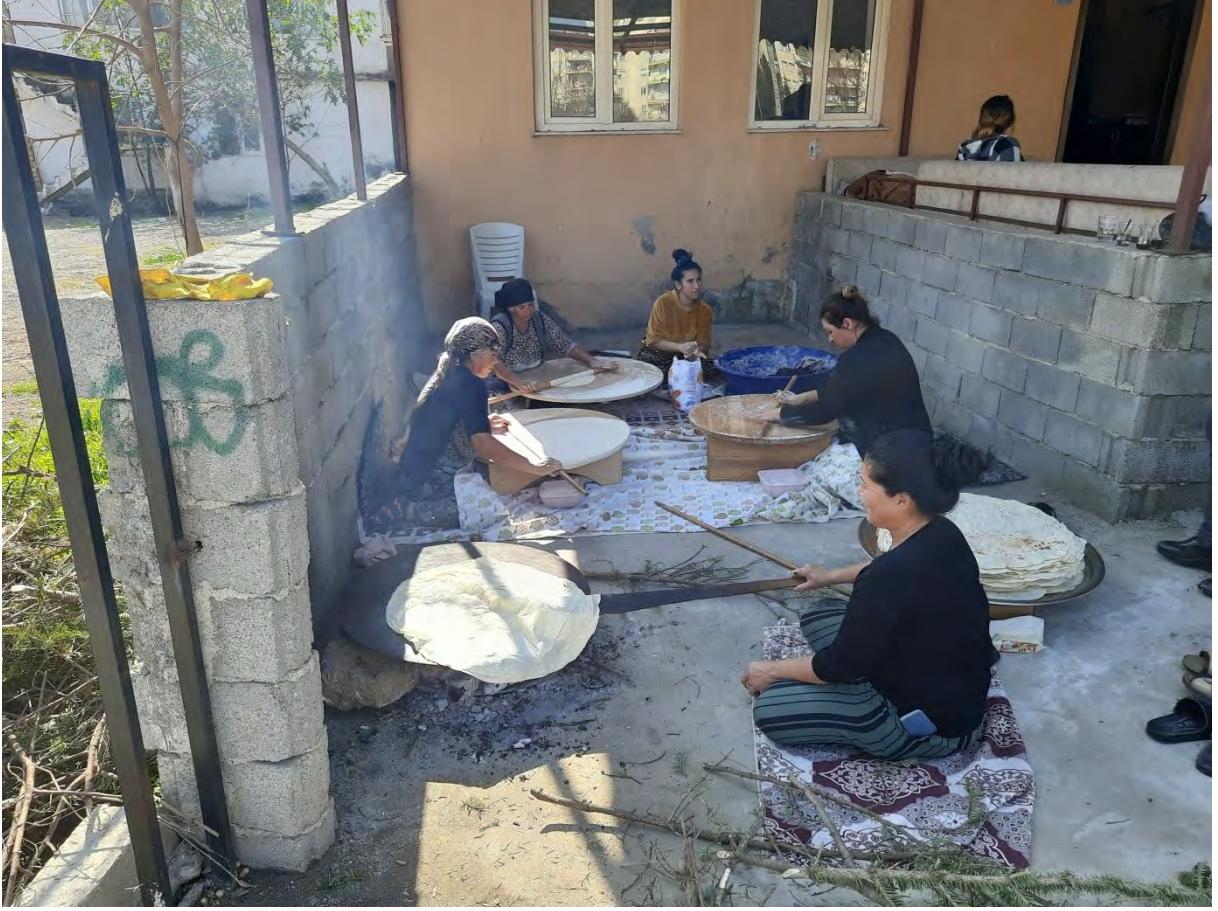
Resim 2: Zeytinköy'de ekmek yapan Abdal Kadınlar

Abdalların kurduğu dernek, bölgede yaşayan Abdalların yaşamlarını kolaylaştırmaya çalışmakta, yerel yönetimlerle sağlıklı ilişkiler kurabilmektedir. Abdalların Alevilik inancı ve değerlerini yaşatmaya çalıştığı bu dernek, Abdalların gündelik yaşamlarına her yönden katkı sunmayı amaçlamaktadır. Yeşildere Mahalle Muhtarı ile yapılan görüşme ve sözlü kaynaklardan edinilen bilgiler doğrultusunda Zeytinköy’de takriben 900-950 Abdal hanesi bulunduğu değerlendirilmektedir. Zeytinköy’de nüfusun önemli bir kısmı Muratpaşa Belediyesi ve Antalya Büyükşehir Belediyesi’nde istihdam olmaktadır.