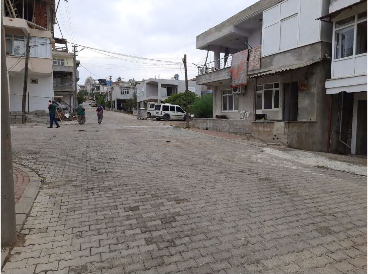
Resim 4: Merkez Mahallesinden Bir Görünüm

Serik, Merkez Mahallesi'nin yaklaşık 17.000 kişilik nüfusa sahip olduğu değerlendirildiğinde Abdalların tahminen 600 kişilik nüfusları ile Merkez Mahallesi nüfusunun %3'ünü oluşturdukları düşünülebilir. Merkez Mahallesi'nde yaşayan Abdallar büyük ölçüde müzik üretimi, çalgıcılık yaparak geçimlerini temin etmektedirler. Bunun yanında Merkez Mahallesi'nde yaşayan Abdallar nakliyecilik, servis şoförlüğü, su tesisatçılığı, turizm otelcilik sektöründe kat görevlisi, otel temizlik görevlisi, belediye temizlik ve cenaze hizmetleri, özel güvenlik hizmeti, mobilyacılık, berberlik, çiftçilik, geçici tarım işçiliği, fidencilik vb. işlerle meşgul olabilmektedir. Merkez Mahallesi'nde yaşayan Abdalların çalışma yaş grubu 18-60 olarak ifade edilebilir. Nitekim sosyal güvencesi olmayan 50 yaş üstündeki Abdallar haftalık ve günlük yevmiye usulü tarım işlerine gidebilmektedir. 1980'li yıllara kadar çadırlarda yaşadıkları öğrenilen Abdallar, 1990'lı yılların sonundan itibaren yerel yönetimlerde temizlik, mezarlık ve çevre düzenleme işlerinde çalışmaya başlamışlardır.