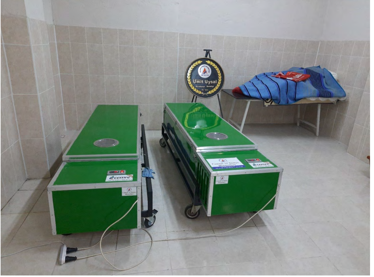
Kaynak: Antalya Zeytinköy Cemevinin Altında Bulunan Morg Odası

Yapılan görüşmelerde mezarlıkların tahsisi ve bakımı için dernek ve muhtarlığın Muratpaşa Belediyesi ile irtibat sağladığı anlaşılmaktadır. İnançları gereği Sünni Müslümanlarla aynı mezarlıklara gömülmesinin doğru olmadığına inanan Abdallar, kendilerine özgü bir mezarlık alanı tahsis etmişlerdir. Aynı şekilde alan araştırmasında Finike, Yuvalı Mahallesi'nde yaşayan Abdalların da kendi mezarlık alanlarının olduğu görülmüştür. Karayağmurlu Ocağı'na bağlı Abdallar, ölülerini cemevine getirerek dedeye yıkatmakta, defin işlemlerini Alevilik inancının öğretilerine göre yerine getirmektedirler. Yapılan görüşmelerde mezarlık alanı ile ilgili bir takım şikâyet ve sitemlerde bulunan Abdallardan bazılarının görüşleri şu şekildedir;