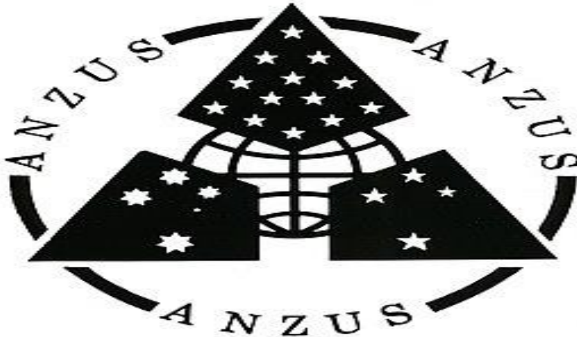
Şekil 2.1 ANZUS Logosu