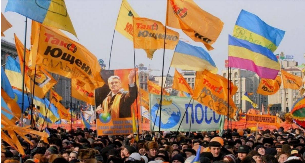
Görsel 4.1 Turuncu Devrim

Kaynak: https://www.timeturk.com/genel/ukrayna-nin-turuncu-devrim-i-nedir-turuncu-devrim-ne-anlama-gelmektedir/haber-1724587 (Erişim Tarihi: 15.05.2022)