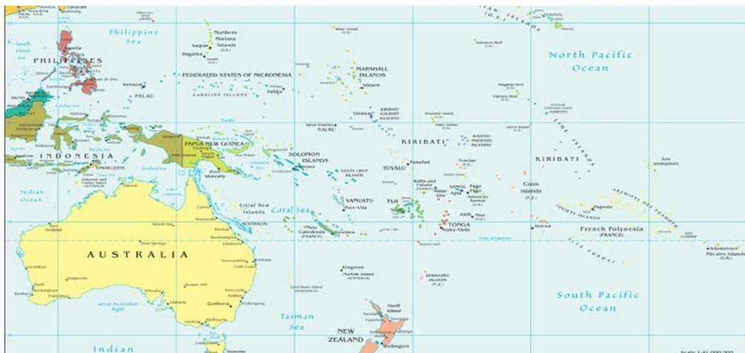
Harita 2.1 Okyanusya Coğrafyası

Çalışmanın bu bölümünde sizlere Okyanusya coğrafyasında bu keşiften sonra başlayan sömürgeciliğin tarihini, Okyanusya’nın ve ülkelerinin coğrafi özelliklerini, Okyanusya’nın jeopolitik önemini ve günümüzde Okyanusya kıtası için büyük bir tehlike arz etmekte olan küresel ısınma ve etkilerinden bahsedeceğiz.