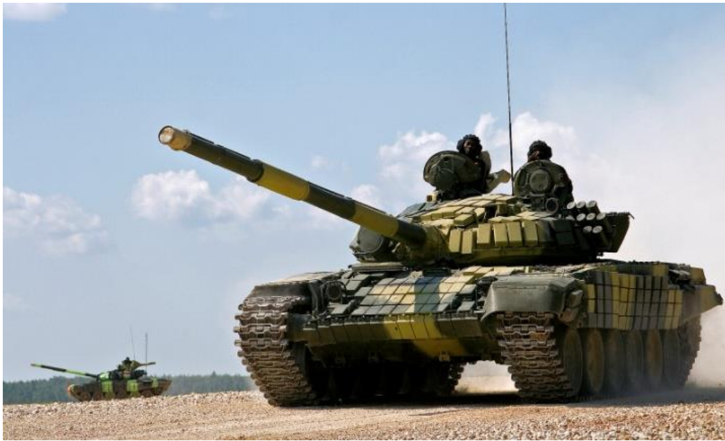
Görsel 4.2 T-72 Tankı

durdurması için ciddi bir kamuoyu baskısı altında kalmaya başlamıştır (Robinson, 2014: 513). Ağustos ayının ortalarında Rus askerileri, Ukrayna’da olduklarına sosyal medyadan mesajlar paylaşmaya başlamış ve Ukrayna ordusu, Moskova hükümetinin sınırı kazayla geçtiklerini iddia ettiği 10 Rus askerini yakalamıştır. Aynı zamanda yalnızca Rus ordusunun askeri envanterinde bulunan T-27 tipi tankların, isyancı taarruzlarının ardından imha edilmiş görüntüleri ağustos ayının sonlarına doğru medyada yayınlanmıştır. Bazı isyancı kaynakların ise ‘otpuskniki’ (tatilciler), ‘rabotniki voentorga’ (voentorg işçileri), ‘severyane’ (kuzeyliler) tarzı kod adlar kullanarak Rus askerlerine göndermelerde buldukları tespit edilmiştir. Moskova hükümeti, Rus askerlerinin Donbass’ta bulunduğunu reddetmiş olsa dahi elde edilen veriler bölgede Rus askeri hareketlerinin yaşandığını net bir şekilde ortaya koymuştur. Kiev hükümeti ortalama 3000-4000 arası Rus askerinin Donbass bölgesine Ağustos 2014 tarihinde giriş yaptığını iddia etmiş olsa da bu sayının tam olarak ne kadar olduğunu söylemek asla mümkün olmamıştır (Robinson, 2014: 513-514).