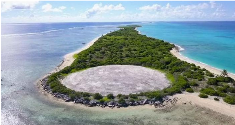
Görsel 2.1 Bikini Atöülü

beklemedik bir şekilde bu aşırı izolasyon durumu Bikini ve Enewetak halklarını nükleer çağa girmesine sebep olmuştur (Johnson, 1979: 10). Birinci Dünya Savaşı sonrası bu bölgelerin sömürge kontrolleri Japonya'ya kaymaktaydı. Japonya ve ABD'nin bölge üzerindeki rekabeti giderek artmaya başlarken İkinci Dünya Savaşında belirleyici olan deniz zaferleri sonucunda bu bölgenin kontrolü ABD'ye geçmiştir (Hirshberg, 2015: 261). Bölge halkı ise bu aşırı izolasyon sonrası yeni kurulan düzenin pek farkında değillerdi.