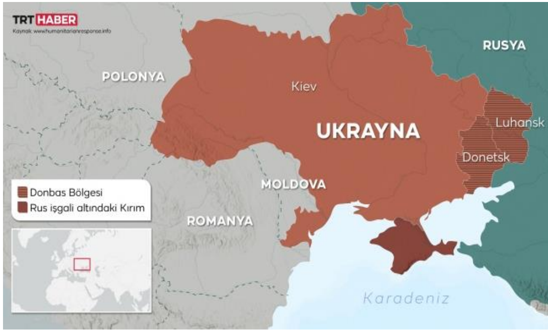
Harita 4.2 Donbass'ın Coğrafi Konum