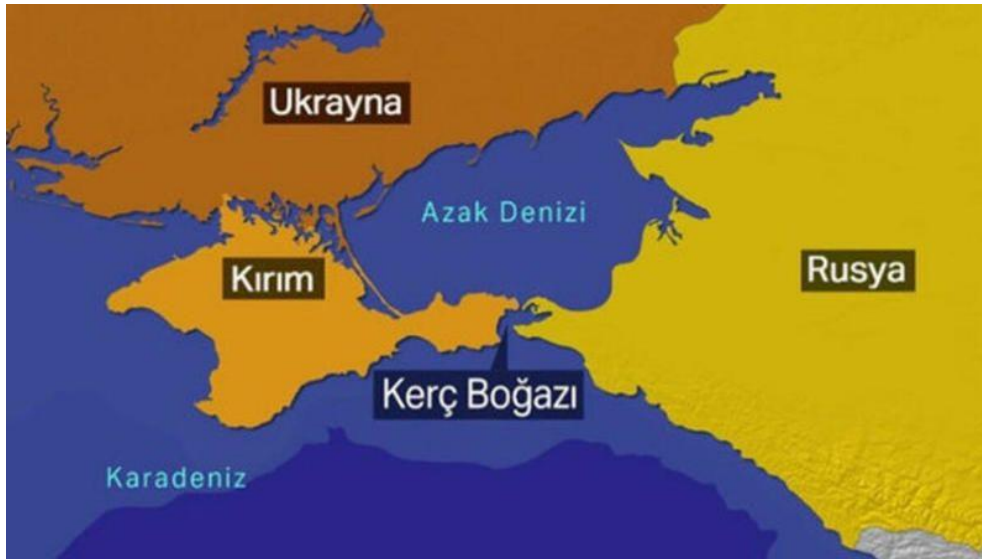
Harita 4.1 Kırım'ın Coğrafi Konumu

sonra bölge üzerinde Rusya'nın devamlı politik etkileri gözlemlenmiştir. İlhak sürecinin başlama noktası ise Yanukovych yönetiminin 28-29 Kasım 2013 tarihinde imzalanacak AB-Ukrayna Ortaklık anlaşmasından, Vilnius Zirvesine 10 gün kala tek taraflı olarak çekilmesi sonucu halk arasında başlayan protestolar olmuştur (Uyaniker, 2018: 140). Turuncu Devrimlere benzetilen bu olaylar ocak ayında giderek şiddetlenmiş ve sonucunda yüzlerce can kaybı yaşanmıştır. Sonuç olarak 28 Ocak 2014 tarihinde Yanukovych istifa etmek zorunda kalmıştır. Ancak Rus yanlısı yönetimin tekrar devrilmesi Rusya tarafında büyük bir hoşnutsuzluk yaratmış ve Rusya gözlerini Karadeniz açısından oldukça büyük bir önem taşıyan Kırım bölgesine çevirmiştir. Yanukovych'in ülkeyi terk etmesinin ardından parlamento tarafından Rusça ve diğer dillerin çok kültürlü bölgelerde resmi dil olarak kabul edilmesini kapsayan kararın geri çekilmesi sonucu bu kez de Donetsk, Luganks ve Kırım gibi Rus kökenlilerin yoğun yaşadığı bölgelerde protestolar başlamıştır. Bu gösterilere ise gelişmelere sert tepki gösteren Rusya tarafından destek sağlanmıştır (Uyaniker, 2018: 142). Yaşanan gelişmeler sonucu Rusya kendisi için jeopolitik önemi olan bu bölgeyi 27 Şubat 2014 tarihinde işgal etmiş, ardından 16 Mart 2014'te gidilen referandum sonucu bölge Rusya'ya bağlamıştır.