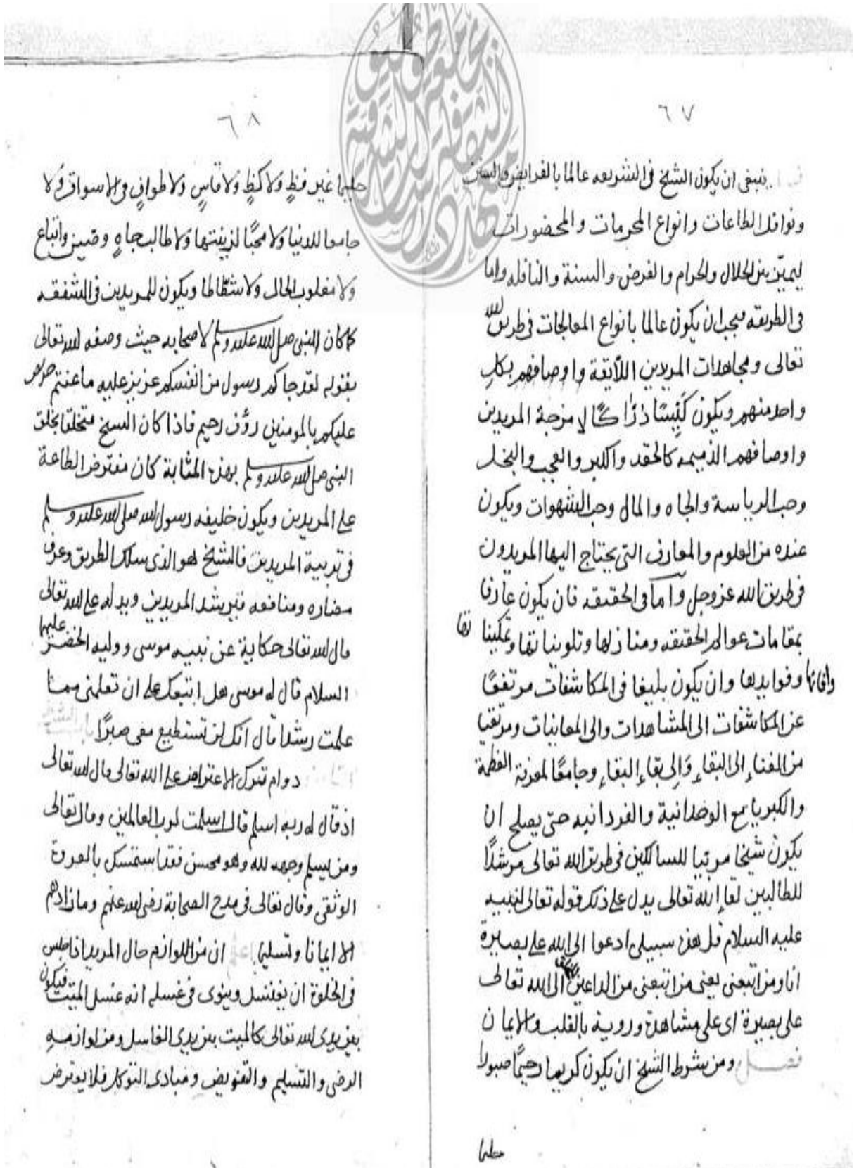
Fotoğraf 4: Japonya Tokyo Üniversitesi Doğu Kültürü Araştırma Enstitüsü'nde bulunan nüshanın son sayfaları