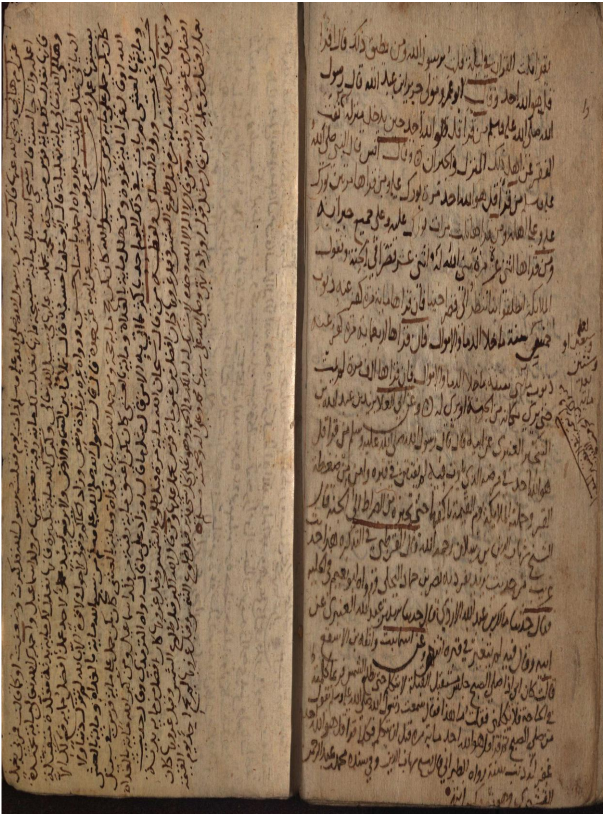
Fotoğraf 8: İstanbul-Beyazıt kütüphanesinde 7893 demirbaş numarasıyla kayıtlı bulunan nüshanın son sayfaları