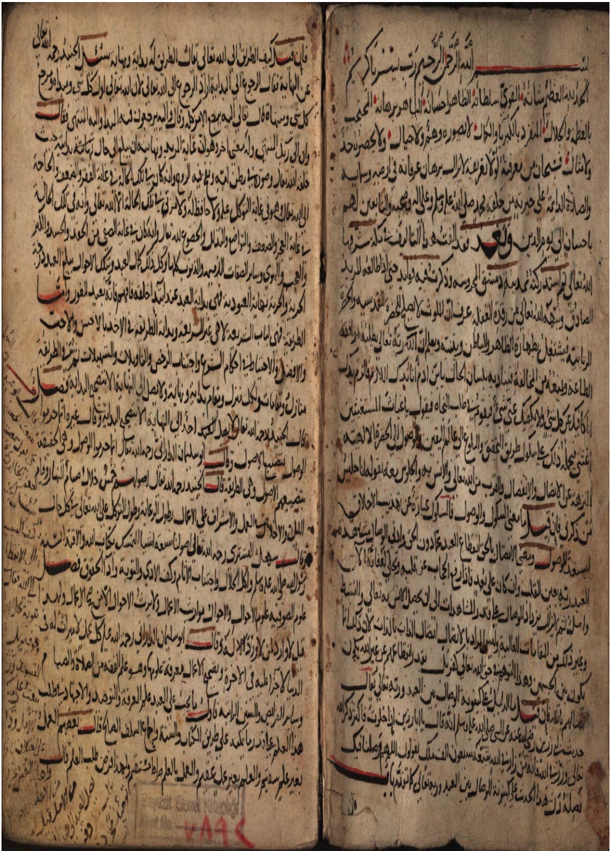
Fotoğraf 7: İstanbul-Beyazıt kütüphanesinde 7893 demirbaş numarasıyla kayıtlı bulunan nüshanın ilk sayfaları