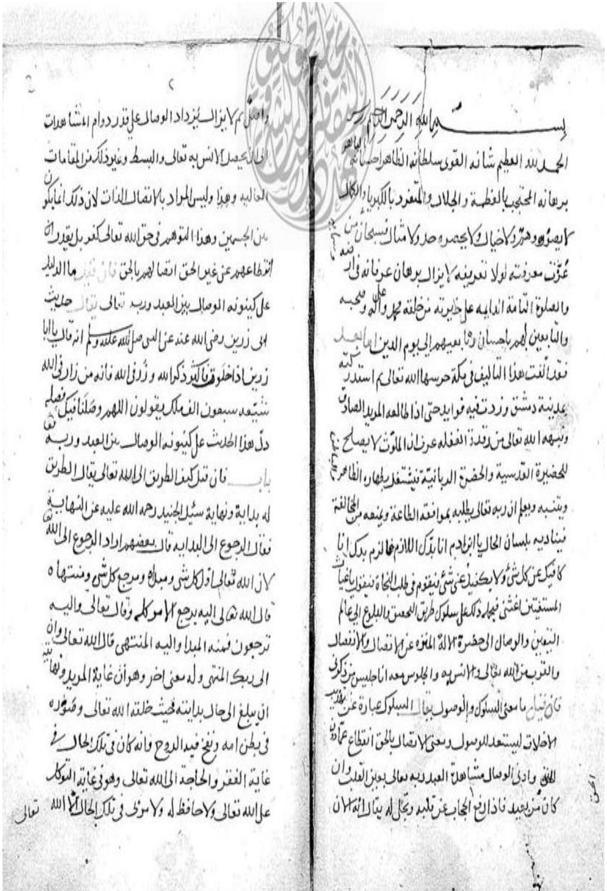
Fotoğraf 3: Japonya Tokyo Üniversitesi Doğu Kültürü Araştırma Enstitüsü'nde bulunan nüshanın ilk sayfaları