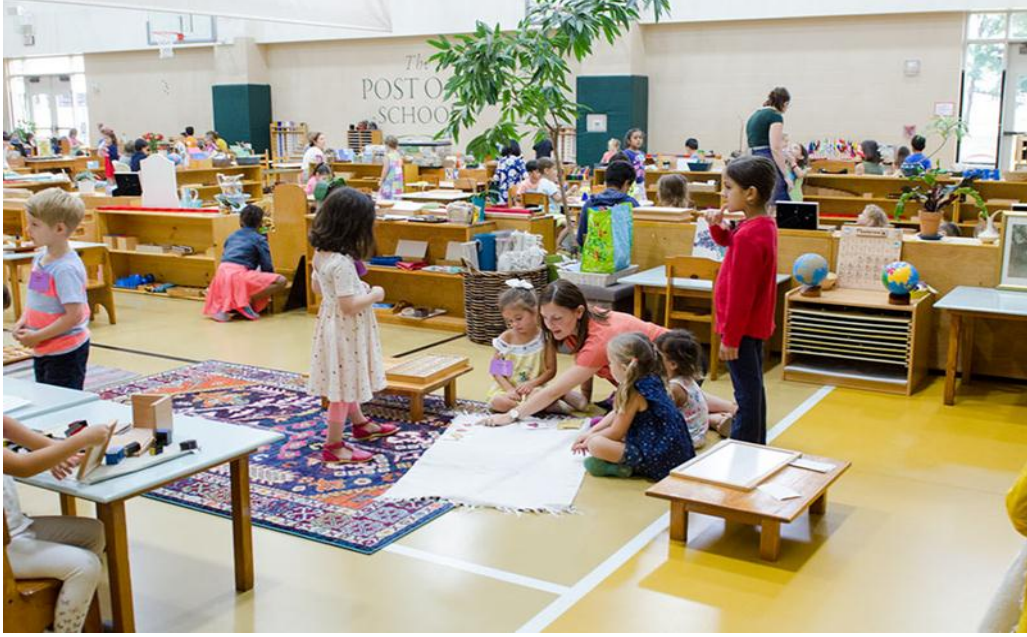
Şekil 6: Montessori Okulları Sınıf Ortamı