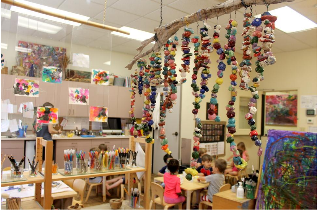
Şekil 11: Reggio Emilia Sınıf Ortamı