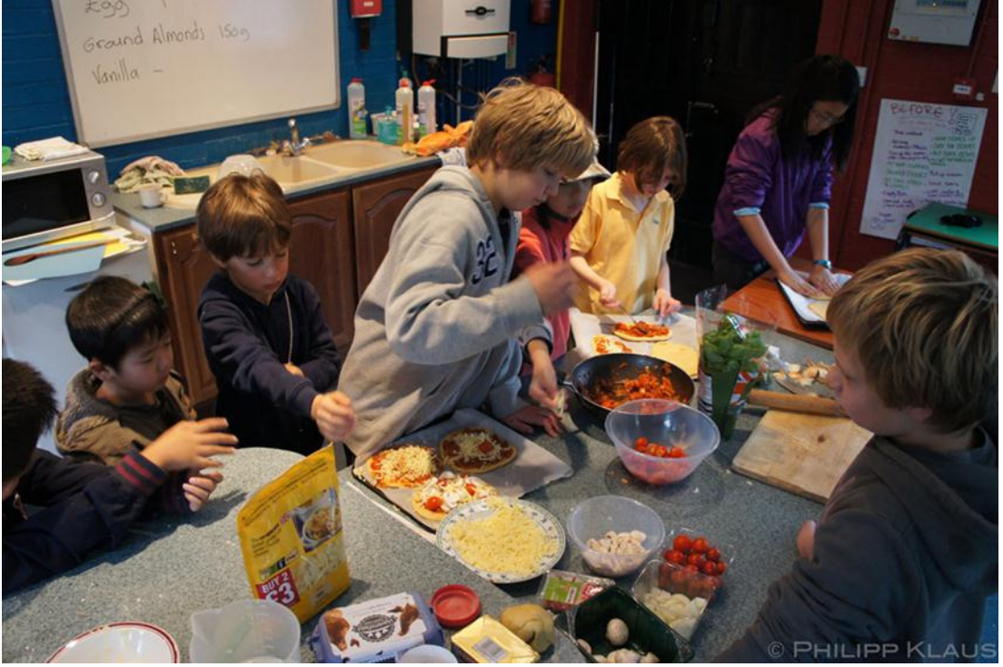
Şekil 5: Özgür Okullar Sınıf Ortamı