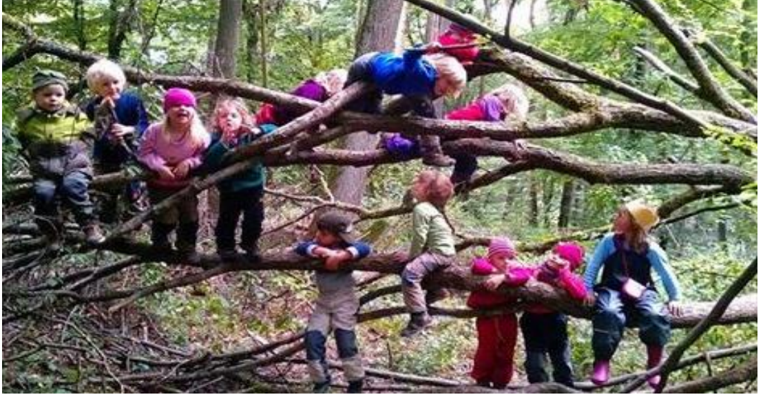
Şekil 13: Orman Okulu