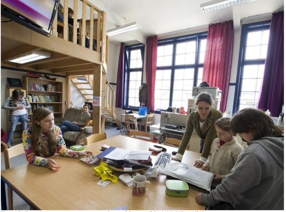
Şekil 4: Demokratik Okullar Sınıf Ortamı