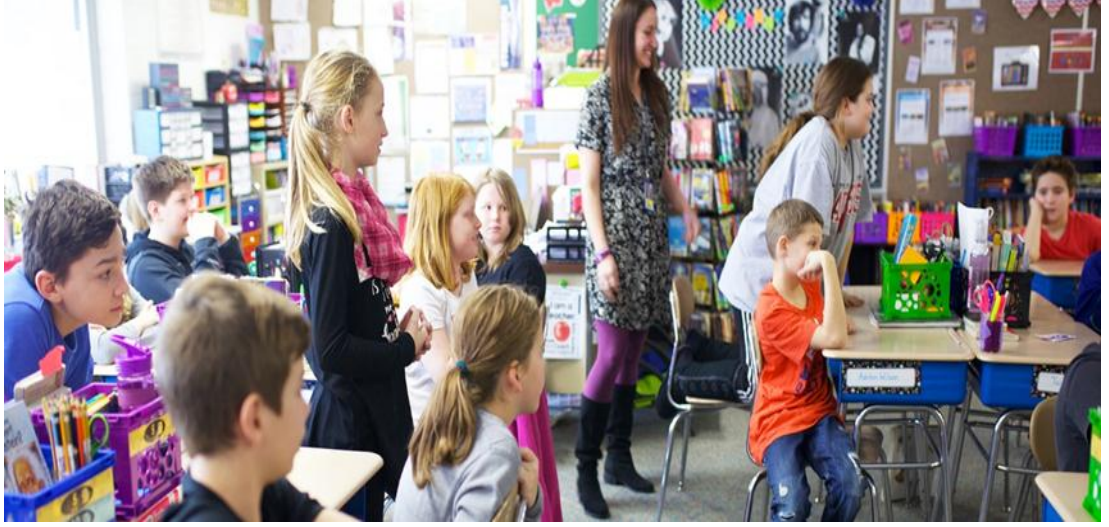
Şekil 7: Serbest/Bağımsız Okul Sınıf Ortamı