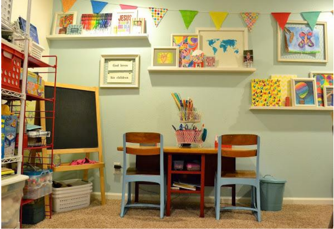
Şekil 9: Ev Okulları Ortamı