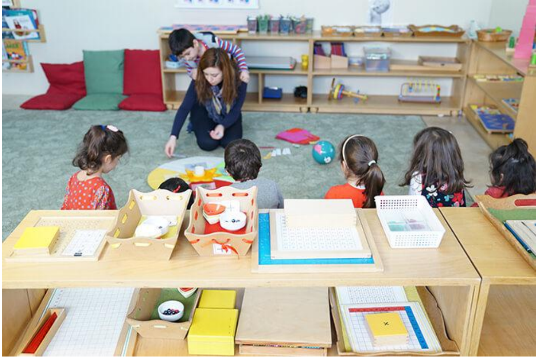
Şekil 12: Alternatif Okul Sınıf Ortamı