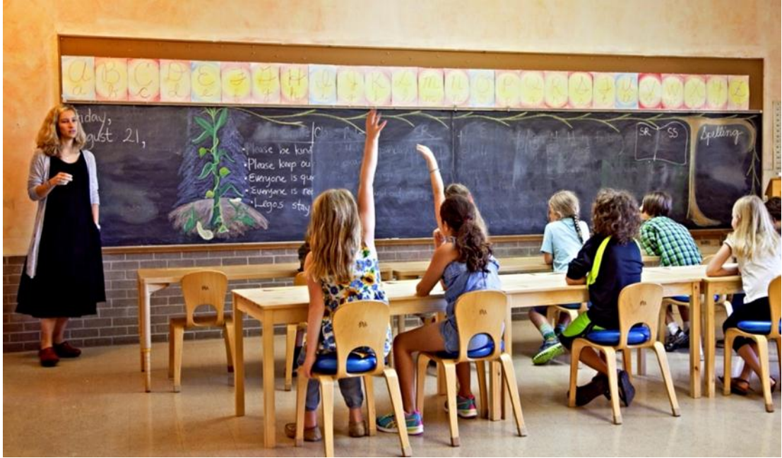
Şekil 1: Waldorf Okulları Sınıf Ortamı