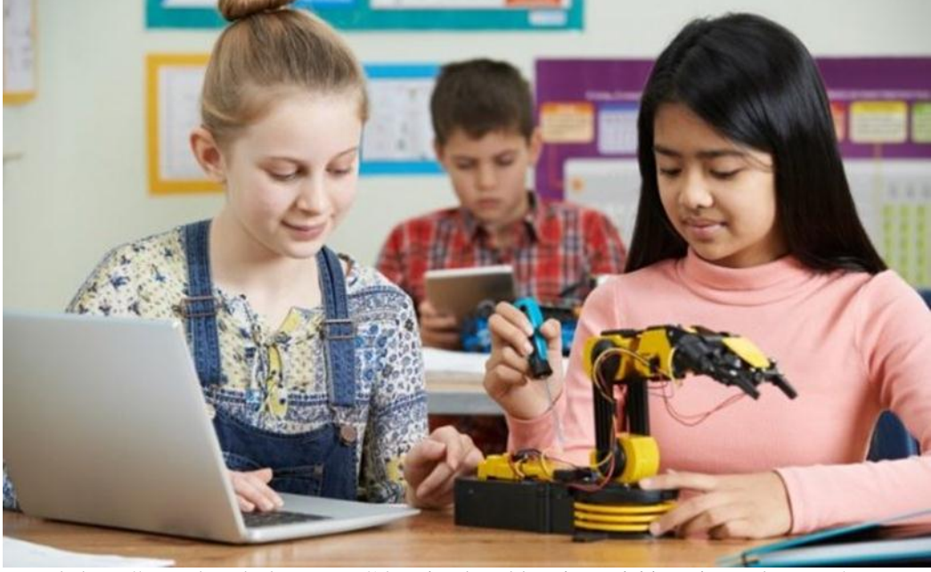
Şekil 2: Proje Okulları Sınıf Ortamı