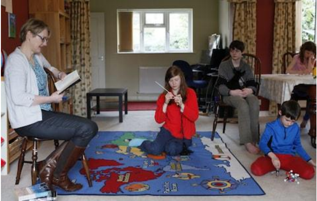
Şekil 8: Ev Okulları Ortamı