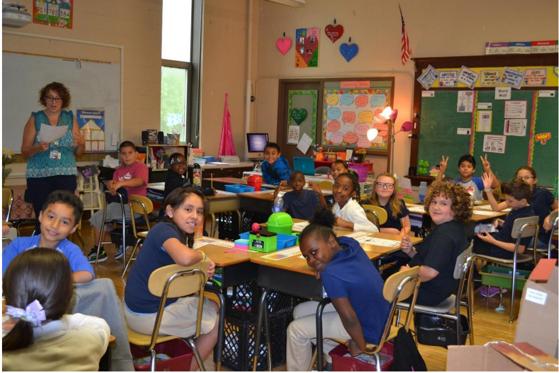
Şekil 10: Mıknatıs Okulları Sınıf Ortamı

dışındaki öğrencilerin de bu okullara kayıt yaptırabilmeleri ve sonuncusu öğrenci ve velilerin bu okulları kendilerinin seçmeleridir.