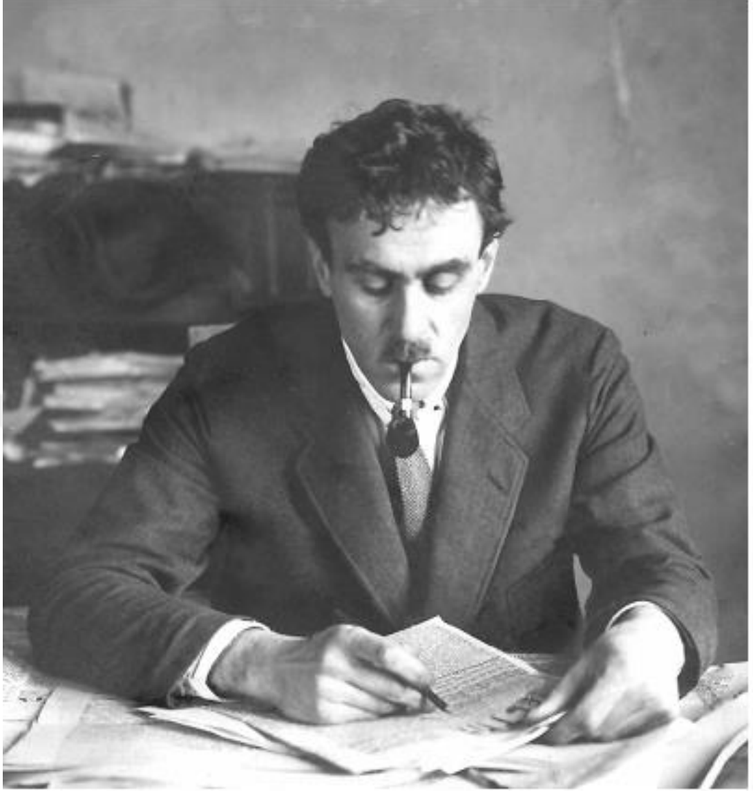
EK 1 –GURKOKRYAJİN (JURAVLEVA, 2003: 4. ALINMIŞTIR).