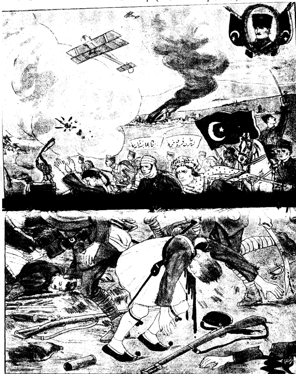
Битва на р. Сакарии (турецкий плакат).