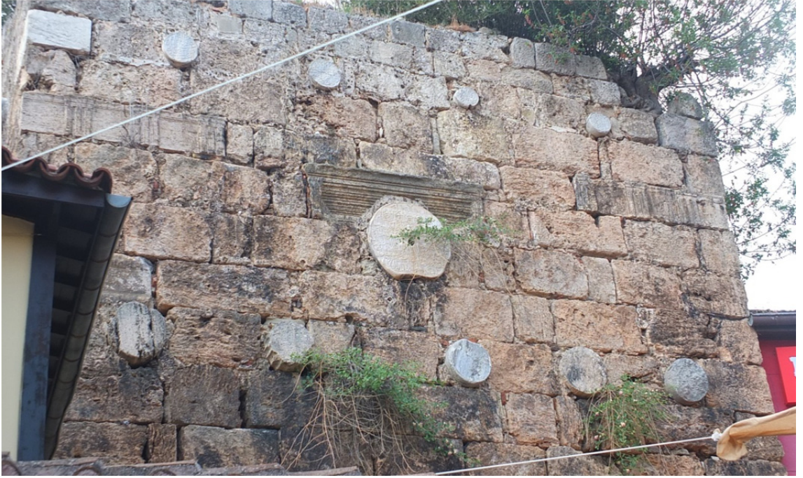
Res. 4: I. İzzeddin Keykavus'un Fetihnâmesi'nin Merkez Kısmı