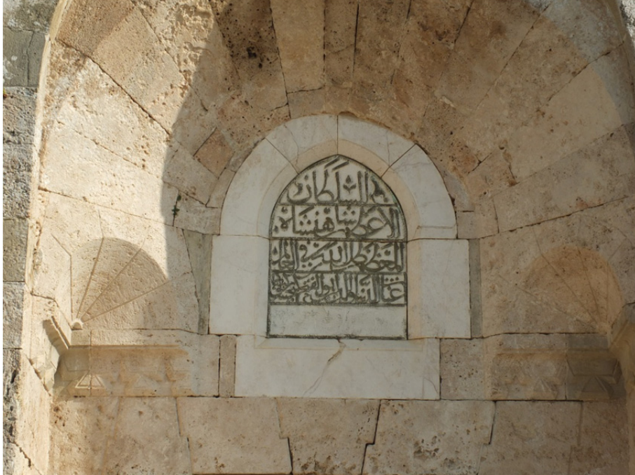
Res. 35: Şarapsa Han Kitabesi