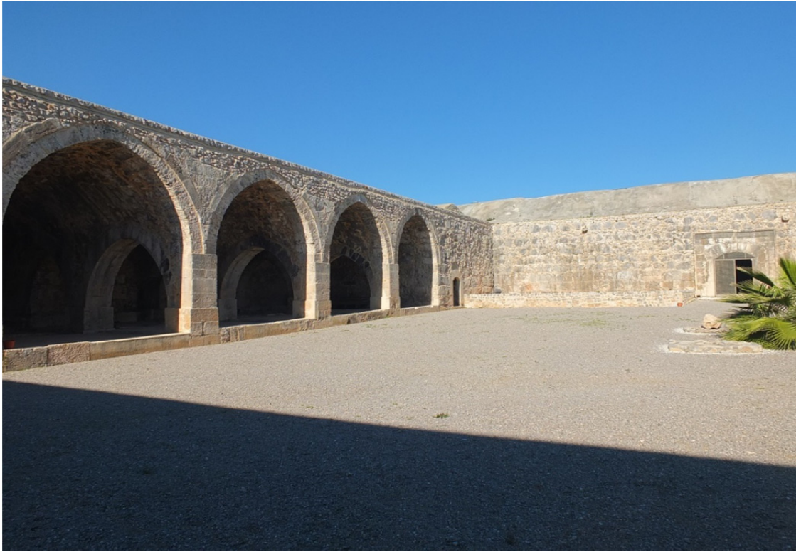
Res. 23: Antalya Kırk Göz Han İç Görünüş