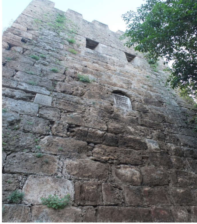
Res. 9: Antalya Surları Burç Detayı