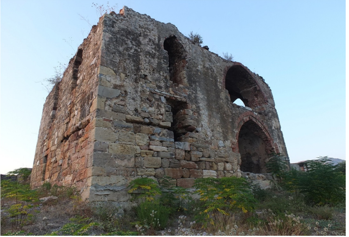
Res. 38: Sedre Köşkü Diğeri Bir Görünüş (Şahsi Fotoğraf Arşivimizden)