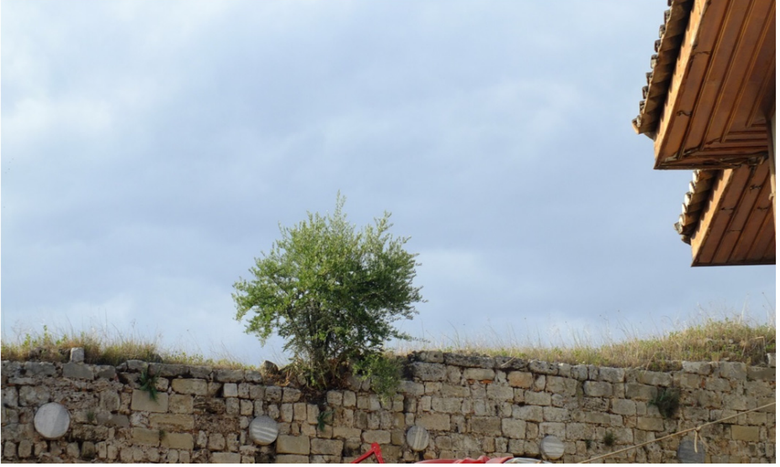
Res. 7: I. İzzeddin Keykavus Fetihnâmesi Parçaları