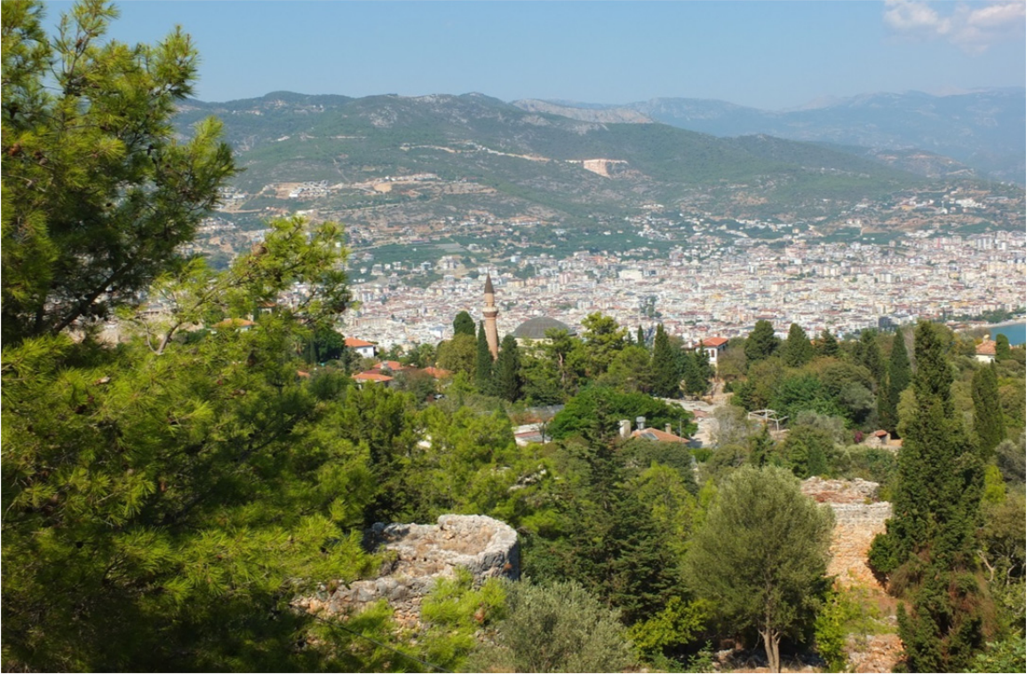
Res. 25: Alanya Kalesi'nden Alanya ve Alaeddin Camii'nin Görünüşü