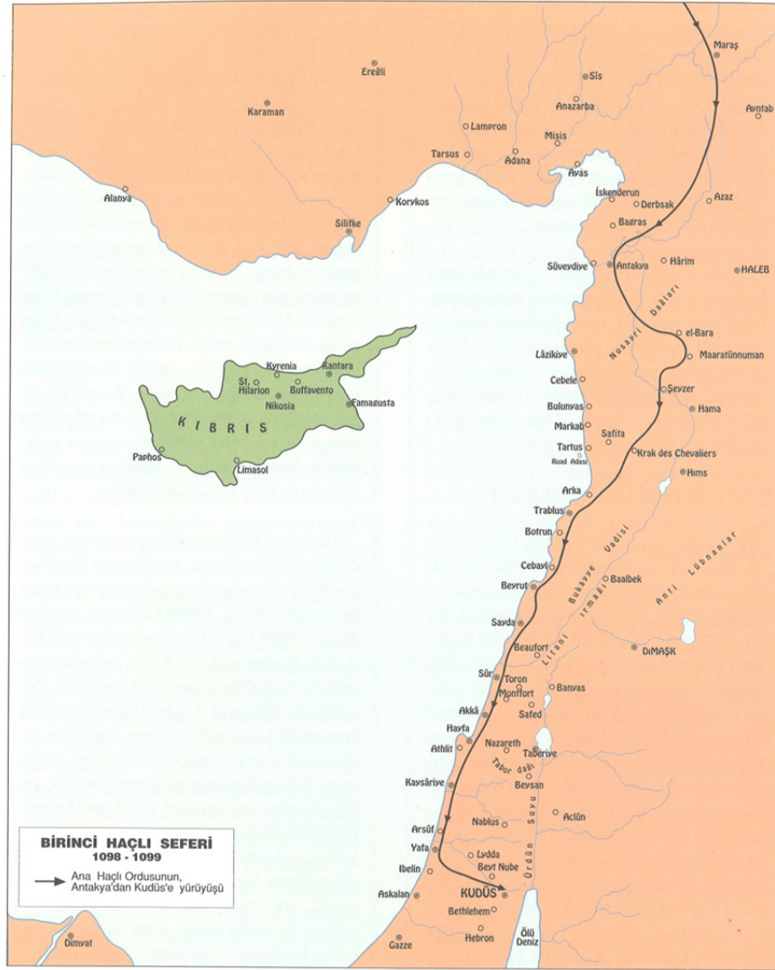
Har. 3: Suriye-Filistin Kıyıları (Demirkent 2004 2 , 48)