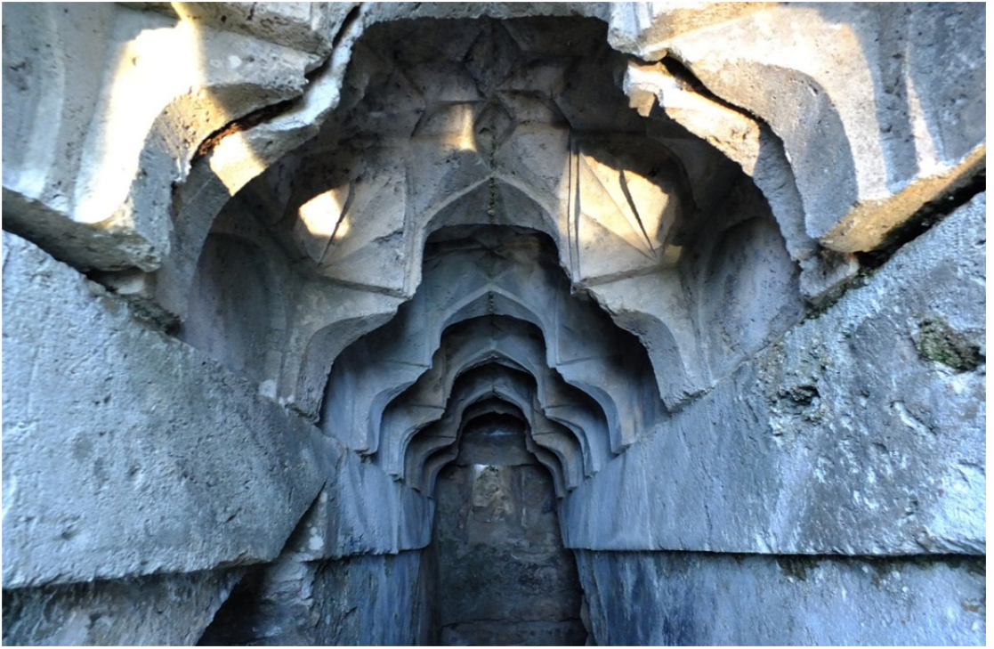
Res. 19: Antalya-Kemer Selçuklu Av Köşkü Merdiven Üstü Detayı