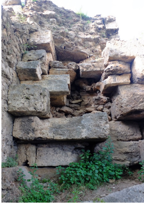
Res. 16: Antalya Surlarından Yapı Detayı