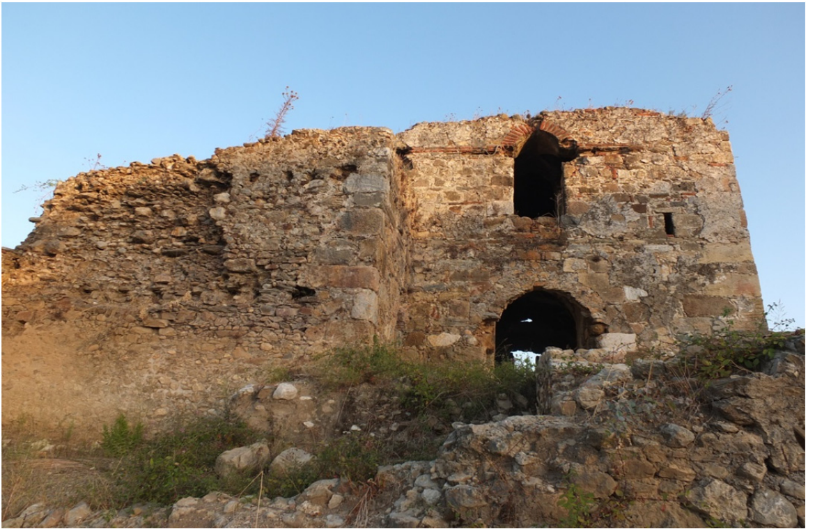
Res. 37: Alanya Sedre Selçuklu Av Köşkü