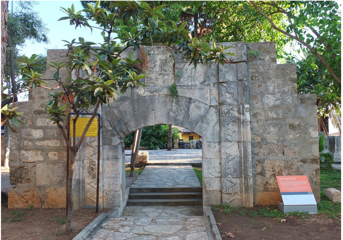
Res. 17: Atabey Armağan Şah Medresesi Portalı