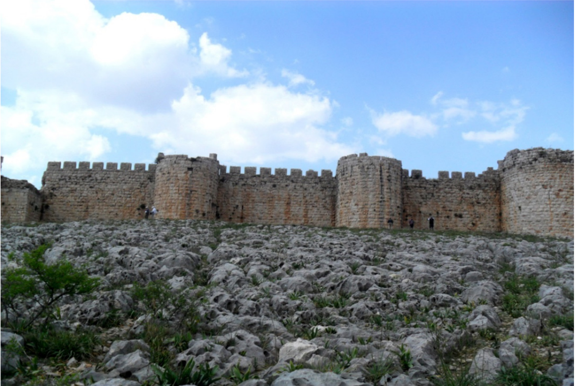
Res. 41: Anazarba Kalesi (Erişim Adresi wikipedia.org 25.05.2017)