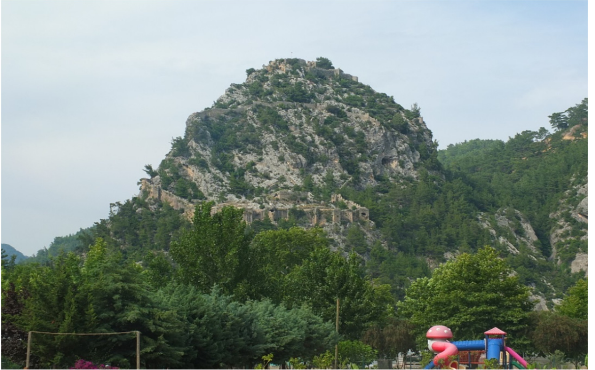
Res. 31: Alara Kalesi Genel Görünüş