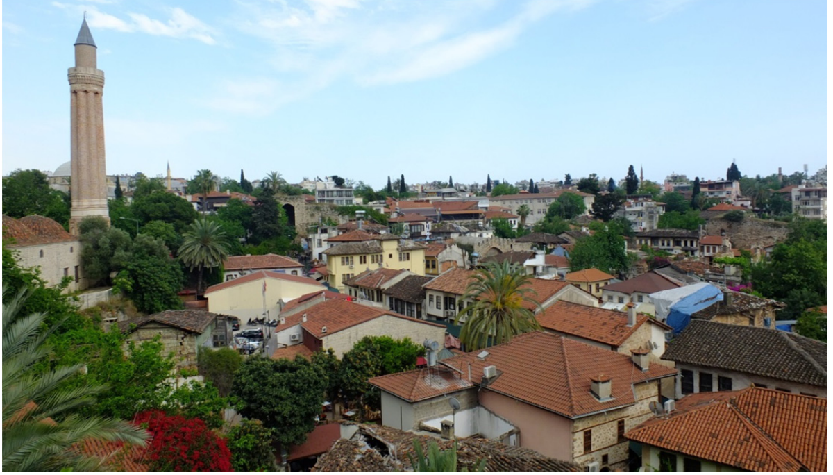
Res.1: Antalya Kalesi Genel Görünüm