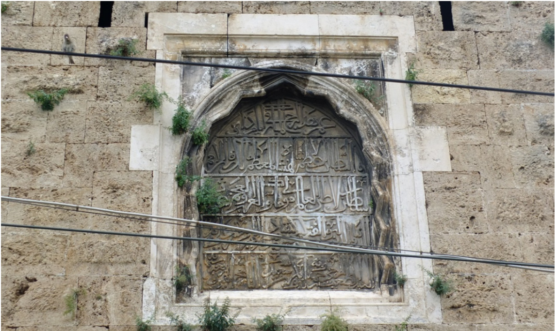
Res. 13: Burç Üzerinde II. Gıyaseddin Keyhüsrev'e Ait Kitabe Detayı