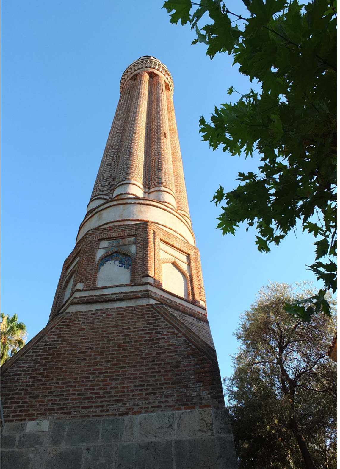
Res. 11: Antalya Yivli Minare Detayı