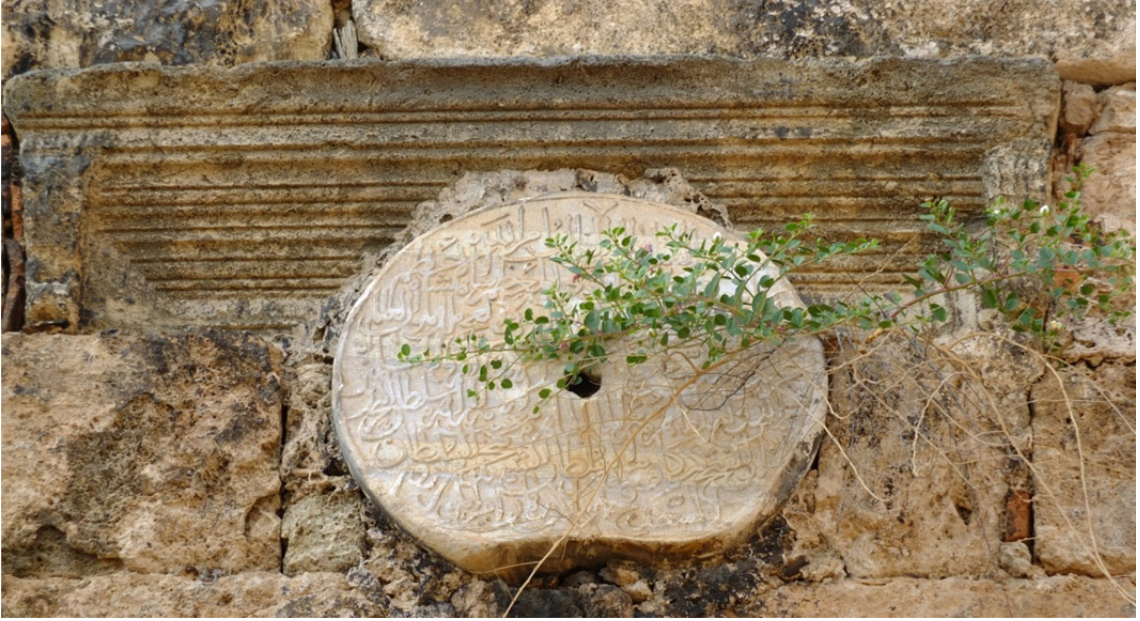
Res. 5: I. İzzeddin Keykavus Fetiĥnâmesi Detayı