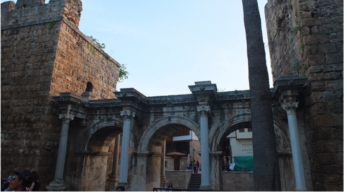
Res. 3: Antalya Hadrianus Kapısı (Üç Kapılar)