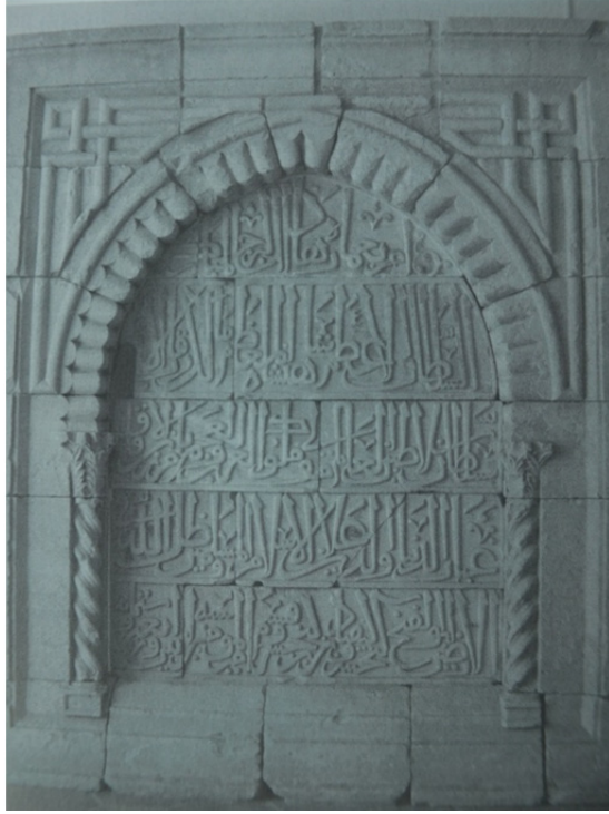
Res. 14: II. Gıyaseddin Keyhüsrev'e Ait Kitabe Detayı (Yılmaz – Tuzcu 2010, 37) Kitabe Antalya Müzesi'nde Env. No: 14 ile sergilenmektedir.