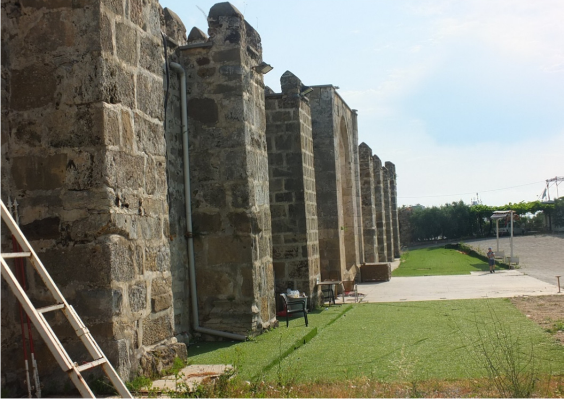
Res. 36: Şarapsa Han Yandan Görünüş