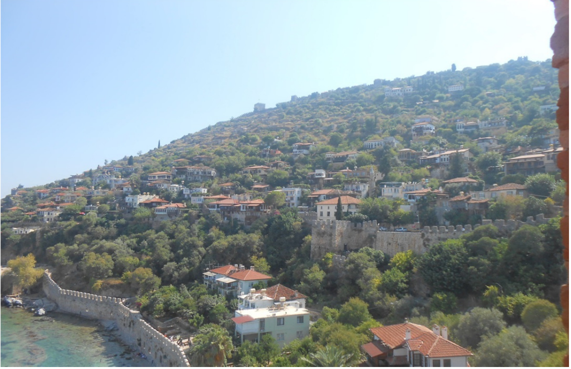
Res. 28: Kızıl Kule'den Alanya Kalesi'nin Görünüşü