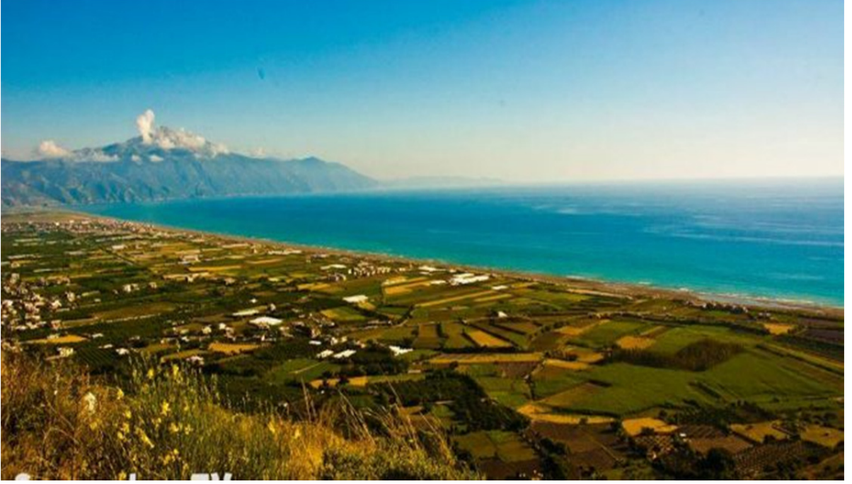
Res. 42: Samandağı (Süveydiye) Sahili (Erişim adresi: www.samandag.tv 02.06.2017)