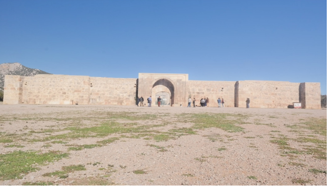
Res. 22: Antalya Kırk Göz Han