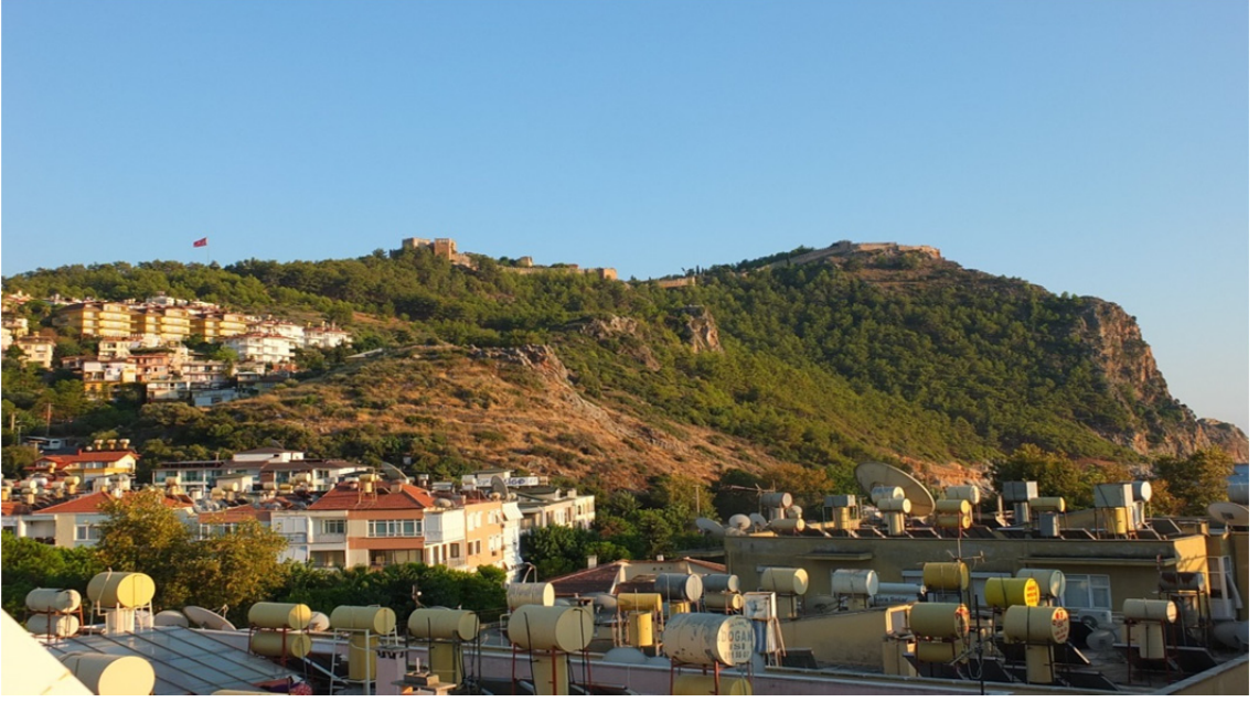
Res. 24: Alanya Kalesi