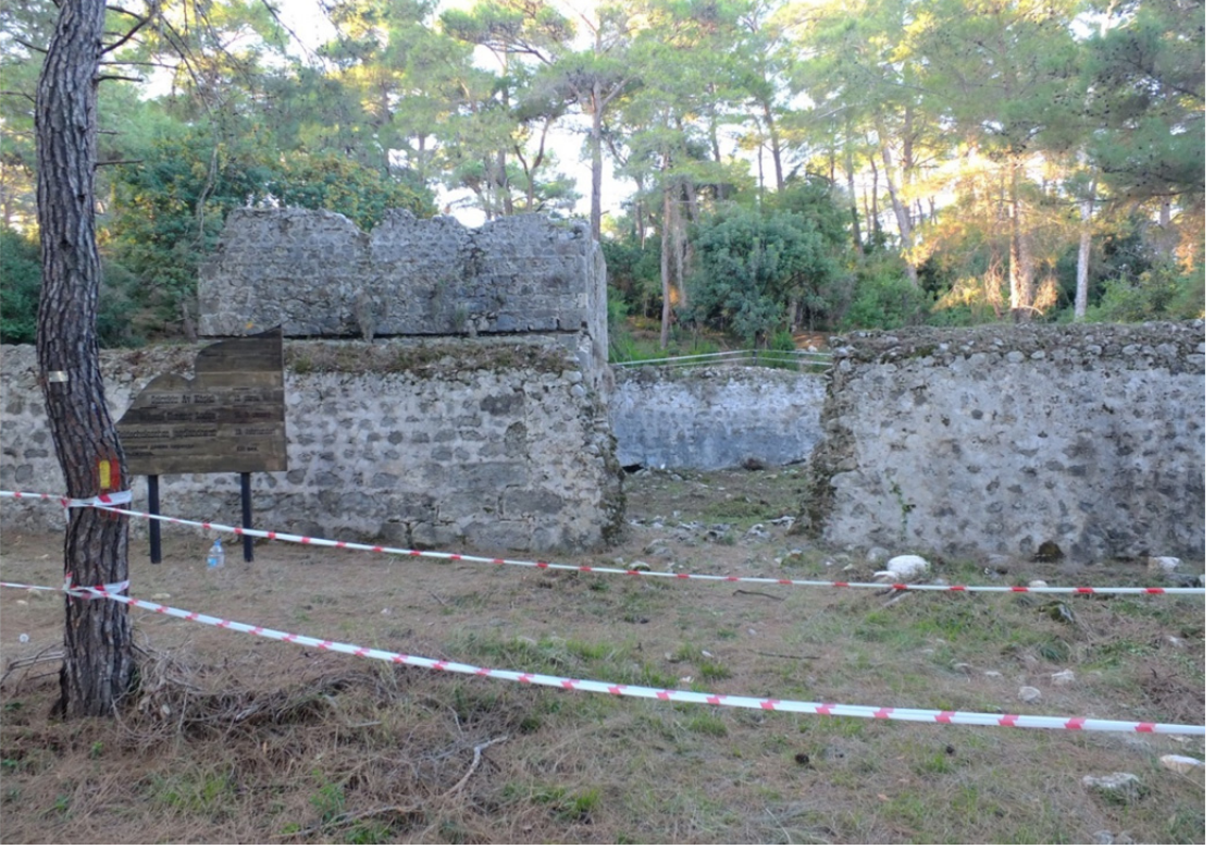
Res. 18: Antalya-Kemer Selçuklu Av Köşkü