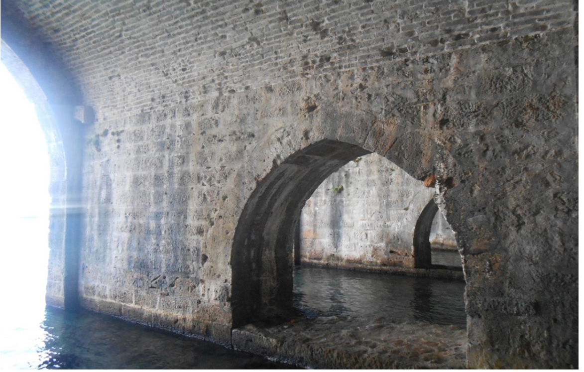
Res. 30: Alanya Tersanesi İç Detayı