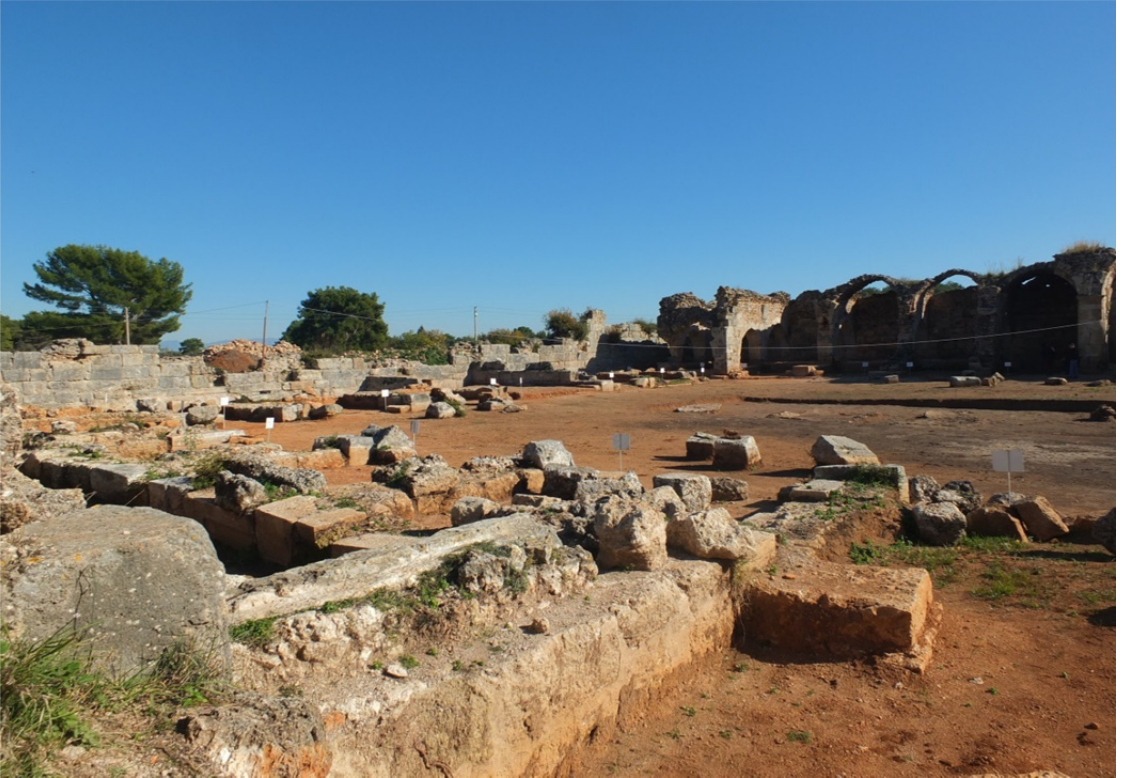
Res. 21: Antalya Evdir Han İç Görünüşü