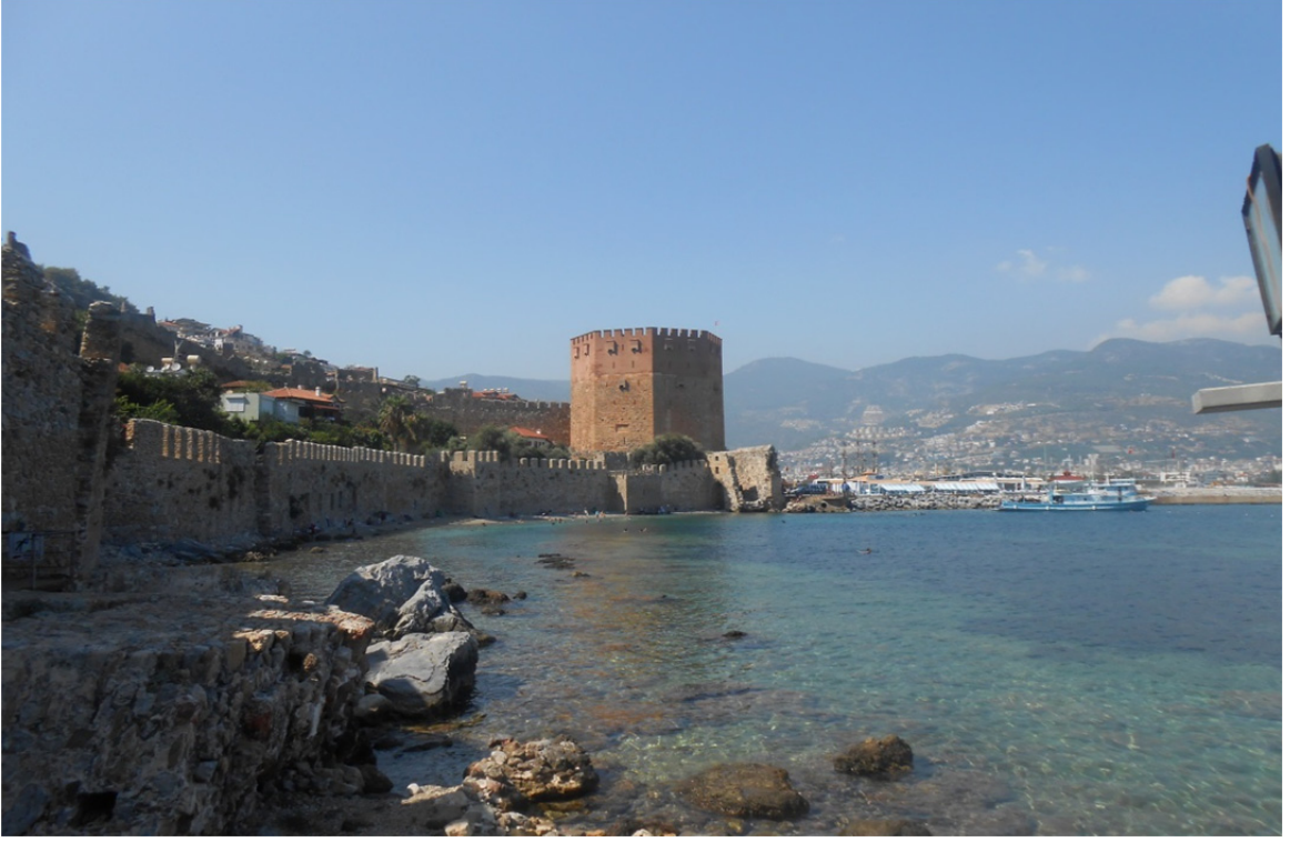
Res. 26: Alanya Tersanesi'nden Kızıl Kule'nin Görünüşü (Şahsi Fotoğraf Arşivimizden)