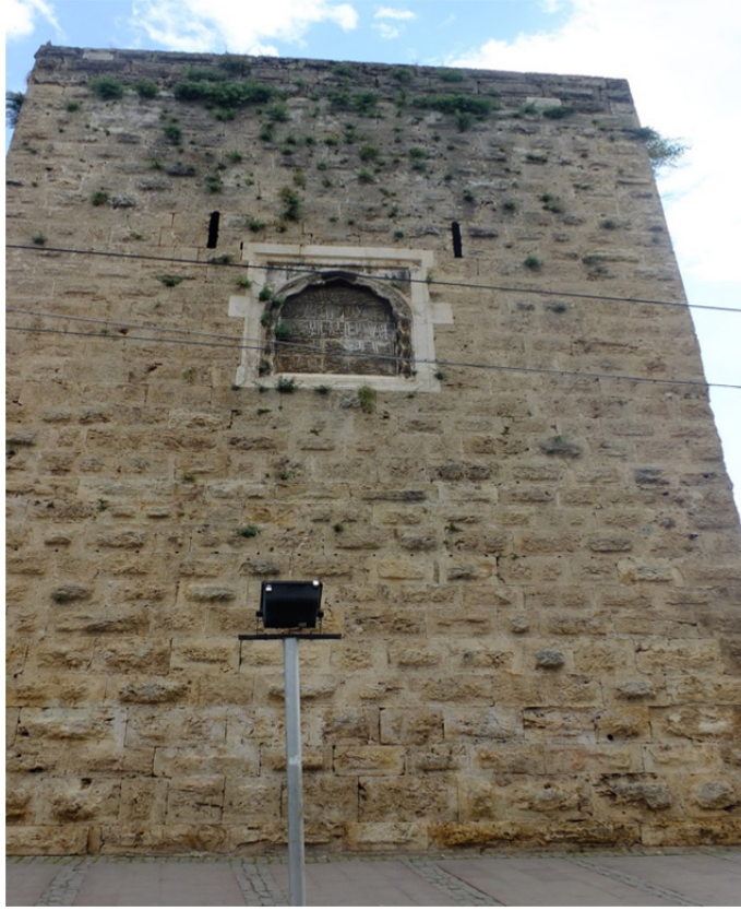
Res. 12: Antalya Surları Burç Detayı