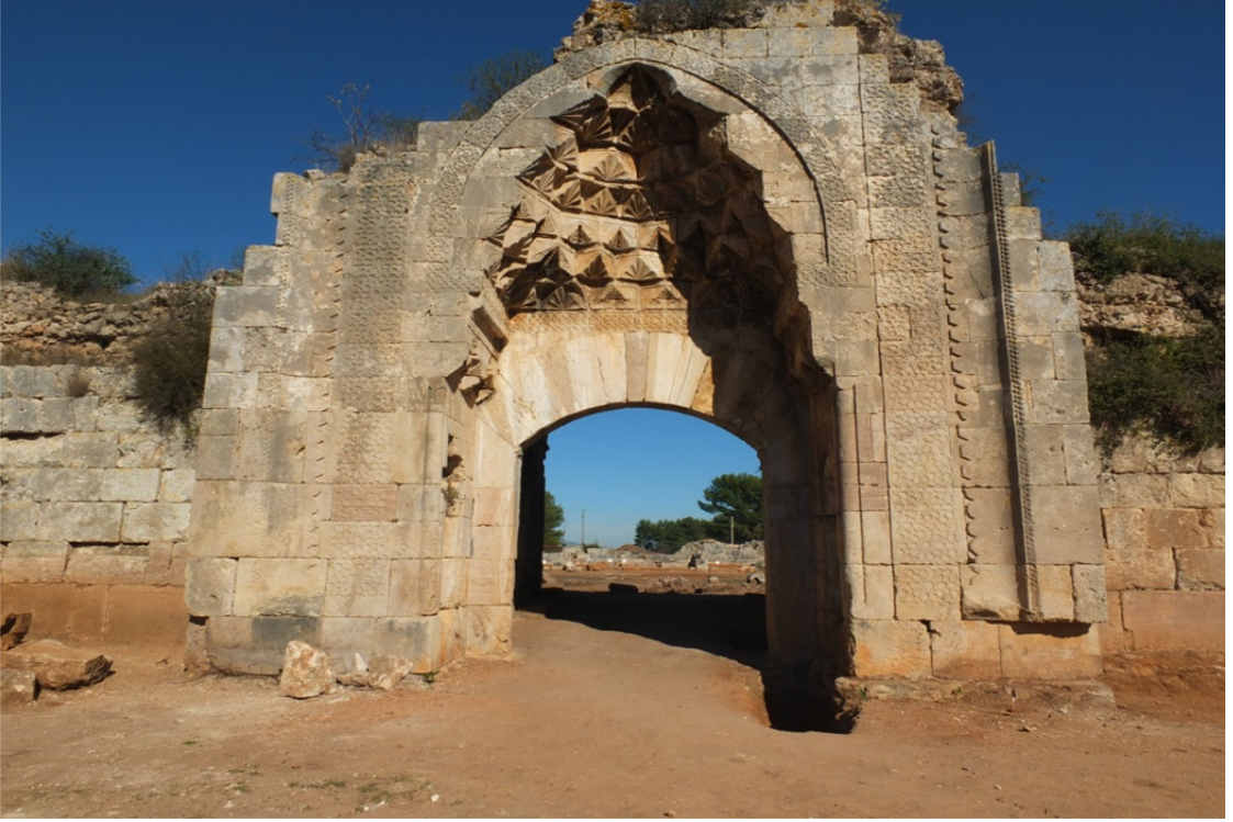
Res. 20: Antalya Evdir Han Giriş Portalı