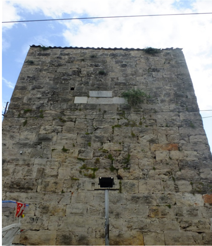
Res. 15: Antalya Surları Burç Detayı