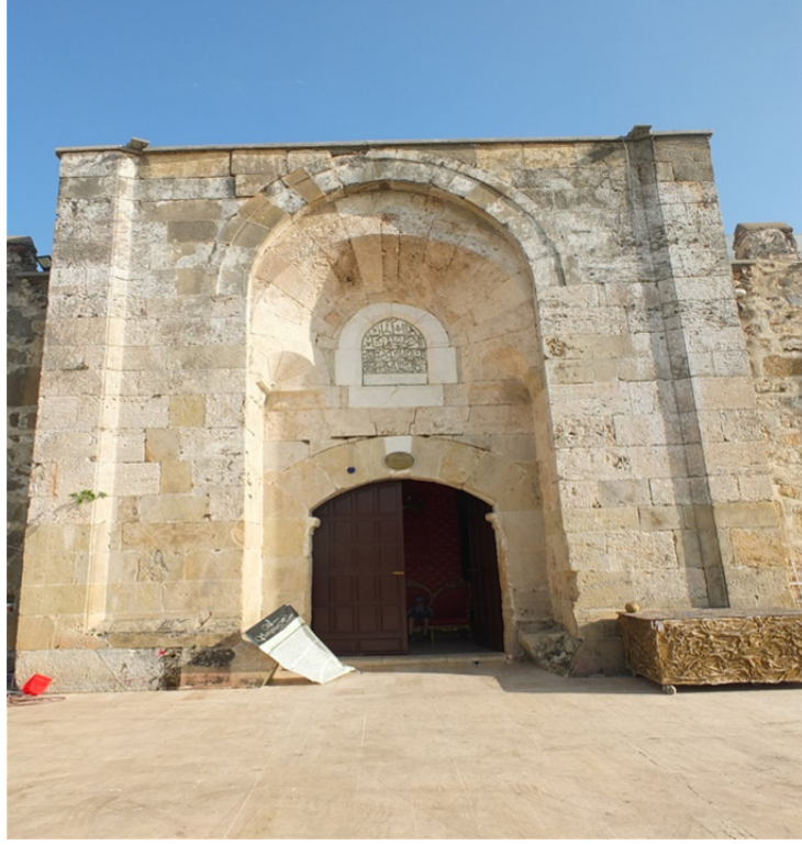
Res. 34: Şarapsa Han Giriş Portalı ve Kitabesi