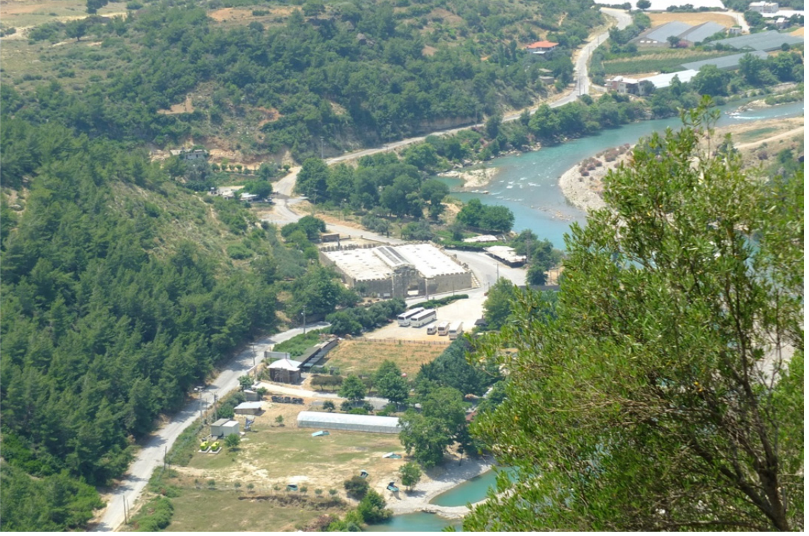
Res. 32: Alara Kalesi'nden Alara Han'ın Görünüşü