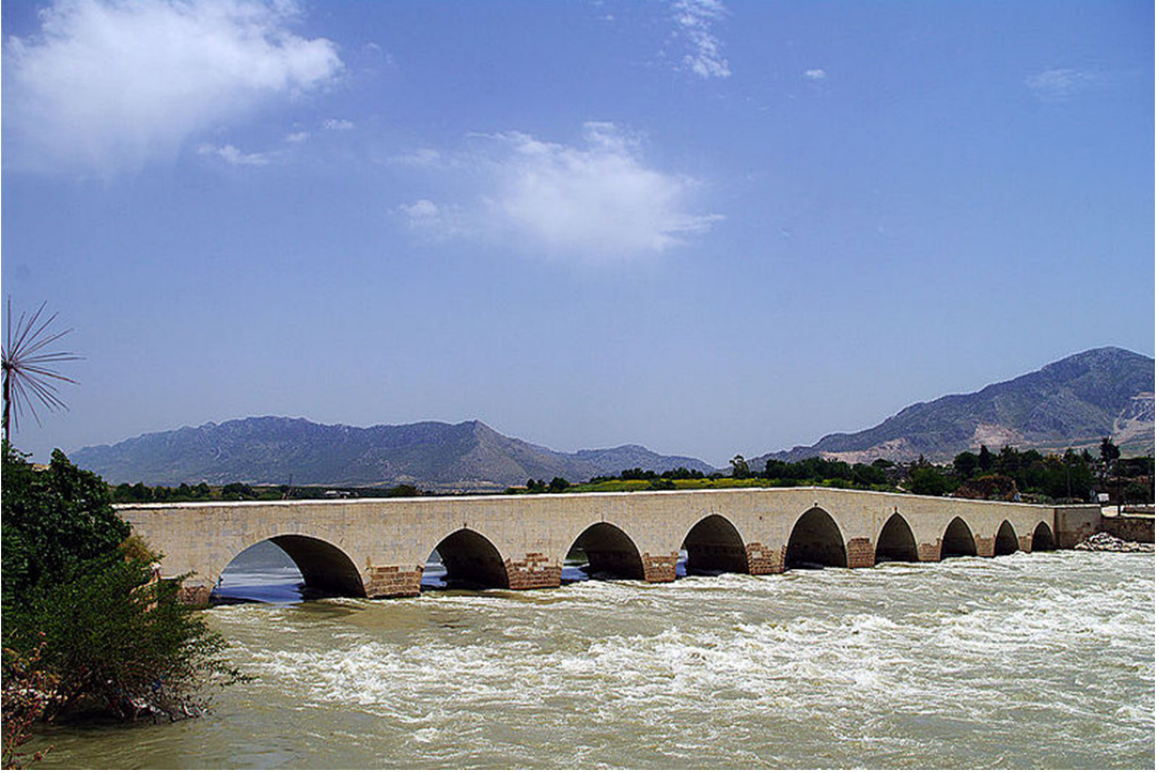
Res. 40: Misis Köprüsü