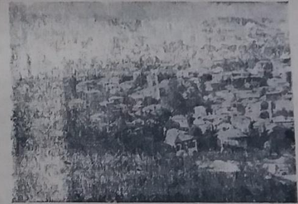
10 binlerce insanı serinleten eğlendiren şehir kalabalık bu günlerde son haddini bulmuş ve dahade bir çok vatandaş bekleyen ELMALI dan umumi bir görüntü