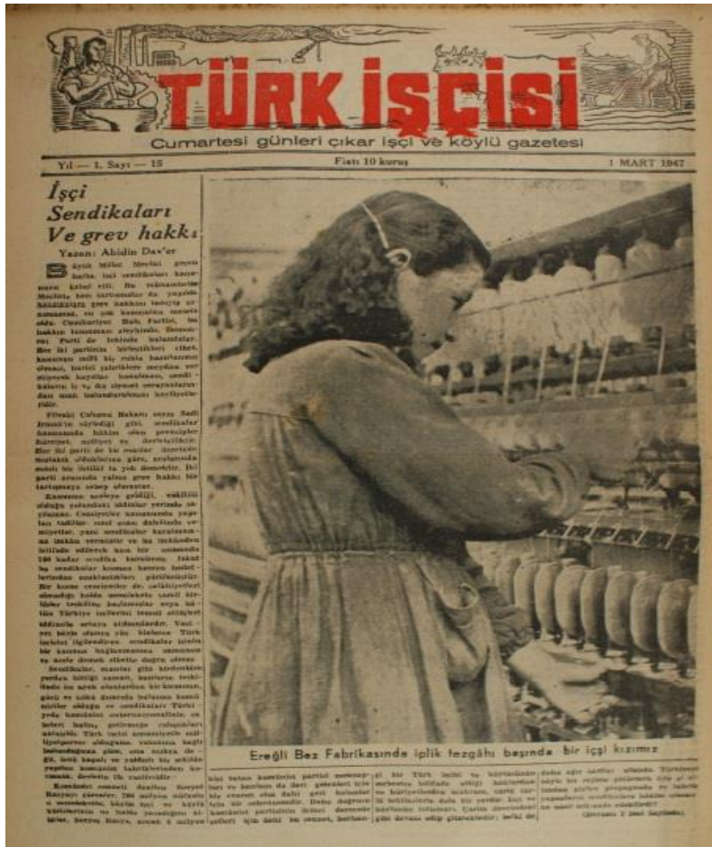
Görsel 4.7 Yeni Açılan İktisadi Devlet Teşekküllerinde Çalışan İşçi Kadınlar

çalışmıştır. Bugün bile önemli bir sorun olan çocuk bakımı konusunda siyasi iktidar, dönem itibarıyla oldukça olumlu ileri bir adım atmıştır.