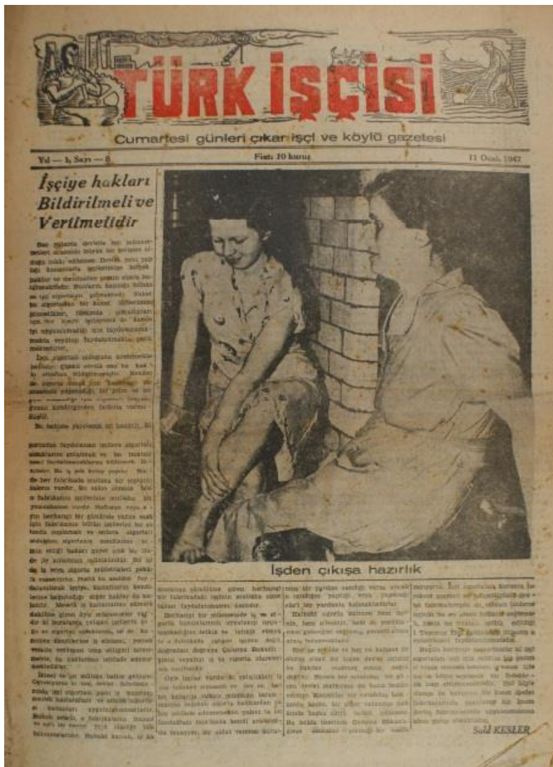
Görsel 4.1 Çağdaş Türk Kadını Miti

toplumlarda gördüğü işlevle eşdeğer olduğu düşünülür. Barthes, miti, birbirleriyle ilişkili kavramlar zinciri olarak açıklar (Fiske, 2003, s.118). Barthes, mitin daima burjuva olduğunu ve tipik olarak mevcut toplumsal düzeni meşrulaştırmak ya da doğallaştırmak amacıyla işlediğini ileri sürmektedir (Smith, 2007, s.152). Böylece kendi kökenlerini ve dolayısıyla siyasal ve toplumsal boyutlarını gizlemlerle veya gizlerler (Fiske, 2003, s.119).