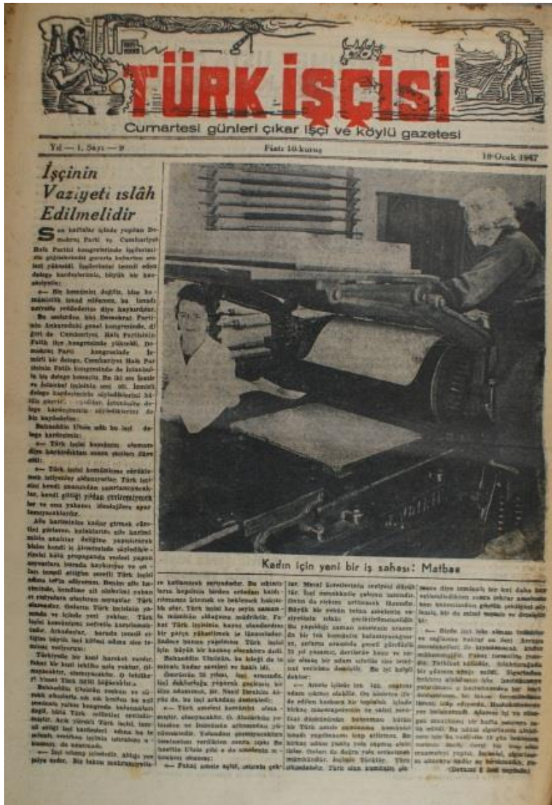
Görsel 4.2 Türk Kadınlarının Geleneksel Alanların Dışında da Üretime Katılması

s.13-39). Kadın ve çocuk işçi sayısının artışında savaş koşulların yanı sıra, yetişkin erkek işgücüne oranla daha düşük ücretle çalıştırılmaları da önemli rol oynamıştır.