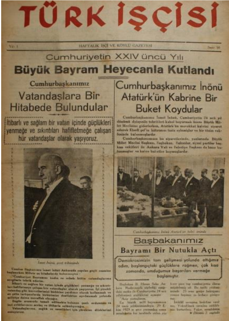
Görsel 4.11 Cumhurbaşkanı İsmet İnönü'nün Vatandaşa Seslenişi

Türk İşçisi'nin 1 Kasım 1947 tarihli 50. sayısında dönemin Cumhurbaşkanı İsmet İnönü'nün Cumhuriyet Bayramı nedeniyle vatandaşlara sesleniş yazısı ile birlikte fotoğrafına yer verilmiştir. Düz anlamda Cumhurbaşkanı İsmet İnönü Türk İşçisi aracılığı vatandaşlara seslenmektedir. Ancak yan anlamda, seslendiği asıl grup işçi sınıfıdır ve şu mesajı vermektedir: “sıkıntılarınız var biliyoruz, koşullarınız kötü ama güçlü, sağlam, itibarlı bir vatan için özgür işçiler olarak çalışıyorsunuz”.