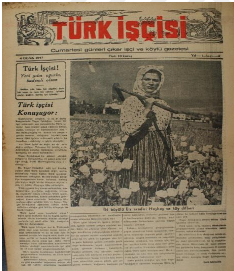
Görsel 4.8 Tarımda Çalışan Kadın İşçi

Ancak yan anlamda söz konusu ailenin fertleri arasında ücret farklılıkları başta olmak üzere eşitsizlikler gözlemlenmektedir. Erkek-kadın işçiler arasındaki ücret farklılıkları, sadece özel kesim işletmelerine özgü bir olgu değildi ve İktisadi Devlet Teşekkülleri'ne bağlı müesseselerde de gözlenmektedir. 1940'lı yılların sonunda, 1 475 işçi çalıştıran ve bunların 1 000'i kadınlardan oluşan Samsun Tekel Tütün Bakım ve İşleme Evi'nde kadınların ortalama saat ücreti 15-16 kuruş iken, erkekler için bu rakam 24-25 kuruştur. Aylık ücret ise kadınlar için 35-40, erkekler için 50-60 lira arasındaydı. 1947 yılı itibariyle, 1 200 işçi çalıştıran Sümerbank Bakırköy Bez Fabrikası'nda çalışanlar ayda 80, iplikteki ustalar 180, kadınlar 75, çocuklar 25 lira ücret almaktaydılar. Tarımda da cinsiyete dayalı ücret farklılıkları olduğu görülmektedir. Tarımda, 1939-1940 yılları arasında, Türkiye geneli itibariyle erkek işçi ücretlerinin 60-100 kuruş, kadın işçi ücretlerinin 30-50 kuruş, çocuk işçi ücretlerinin ise 20-35 kuruş dolaylarındadır (Makal, 2010, s.13-39). Kadın ve çocuk çalışan sayısının artmasında, bu kesiminin erkek işgücüne oranla daha düşük ücretle çalıştırılması ve yine yetişkin erkek işgücüne oranla çalışma koşullarına karşı direnme ve örgütlenme eğiliminin geleneksel olarak düşük olması gibi faktörler de önemli oynamıştır.