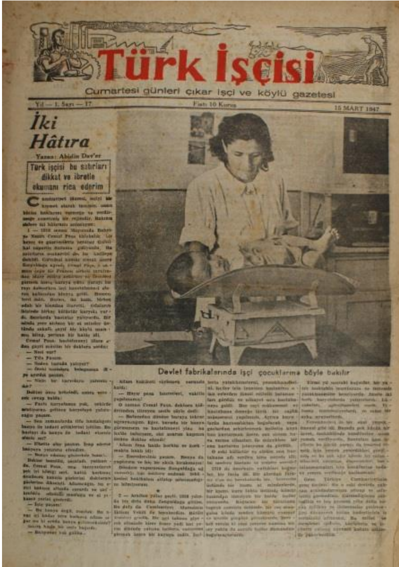
Devlet fabrikalarında işçi çocuklarına böyle bakılır