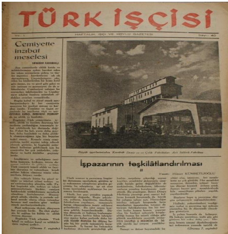
Görsel 4.9 Devlet Fabrikalarından Görünüm

Cumhuriyet Dönemi'nde cinsiyete dayalı ücret farklılıklarının evrensel eğilimlere uygun olarak Osmanlı İmparatorluğu'ndakine benzer biçimde devam ettiği görülmektedir. Türk İşçisi'nin 4 Ocak 1947 tarihli 7. sayısının ilk sayfasında yer alan görselde düz anlam haşhaş tarlasında çalışan güzel bir kadın işçisi fotoğrafıdır. Fotoğraf altında "İki büyüğü bir arada: Haşhaş ve köylü dilberi" ifadesi yer almıştır. Yan anlamda ise tarımsal üretimde de kadın işgücünün önemi vurgusunun yanı sıra cinsiyetçi bir dil kullanılarak, kadının da haşhaş gibi büyüleyici olduğu işaret edilmiştir. Gazete bu noktada kadına bakışıyla da çelişir.