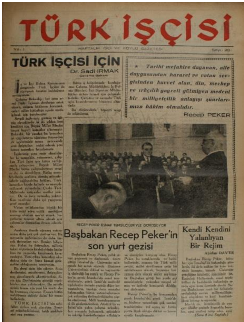
Görsel 4.10 Başbakan Recep Peker'in Esnaf Temsilcileriyle Görüşmesi

Yine bu dönemde siyasi lider fotoğraflarına, çıkartılan otuz yedi sayının on dördünün ilk sayfalarında yer verilmiştir. Siyasi liderler, dönemin iç ve dış politik söylemlerinin kodlanmasında hem haber, hem de güvenilir haber kaynağı olmuşlardır.