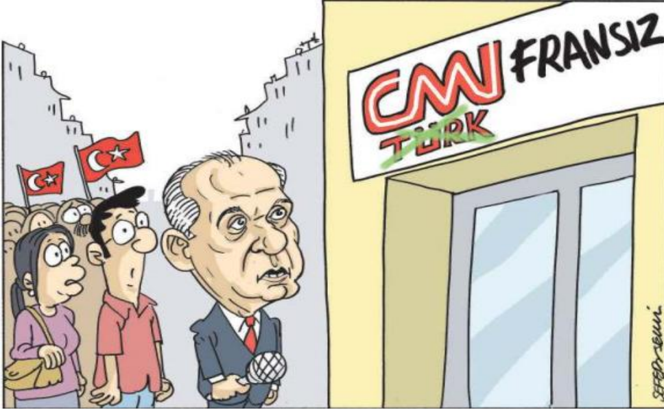
Görsel 3.15. Leman dergisi, Sayı 21, 23 Mayıs 2018 tarihli karikatür.

Mizah Kuramlarına göre yorumu: Karikatür görüntüsünde Erdoğan, Bahçeli ve Yıldırım'ın seçim sandıklarının başında dikkatli bir şekilde bekledikleri görülmektedir. Bu eylemi siyasiler değil, YSK kontrolünde sandık görevlileri ve gözlemciler gerçekleştirmektedir. Dolayısıyla karikatürde yer alan durum, mizahın “uyumsuzluk” kuramıyla ortaya koyulmuştur.