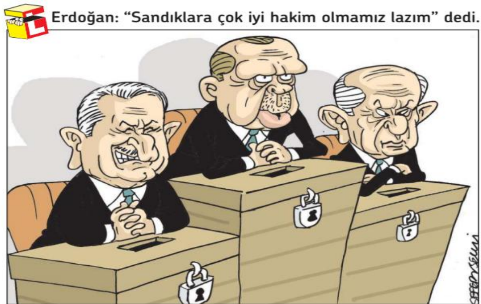
Görsel 3.14. Leman dergisi, Sayı 20, 16 Mayıs 2018 tarihli karikatür

Mizah Kuramlarına göre yorumu: İncelenen karikatürün mizahın üstünlük ve uyumsuzluk kuramlarıyla ilişkili olduğu görülmektedir. Karikatür görüntüsünde Erdoğan’ın “oy vereceksiniz” yönündeki ifadeleri ve kalabalığın yukarısında görülmesi “üstünlük” kuramı ile bağdaşmaktadır. Seçim öncesinde kalabalık gruba “oy vereceksiniz” şeklinde bir ifade kullanan politikacı tasviri ise “uyumsuzluk” kuramı çerçevesinde mizahı oluşturmuştur.