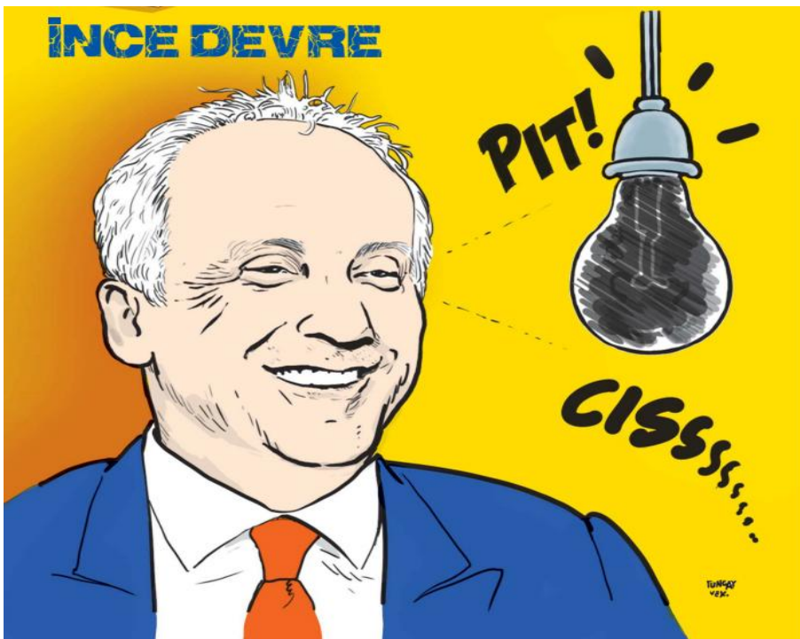
Görsel 3.17. Leman dergisi, Sayı 23, 20 Haziran 2018 tarihli karikatür

Mizah Kuramlarına göre yorumu: İncelediğimiz karikatür mizahın “uyumsuzluk kuramı”na uygun olarak çizilmiştir. Sabaha karşı havanın henüz aydınlanmadığı bir vakitte, elinde seçim sandığıyla KYK'yı ziyaret etmeyi planlayan bir politikacı, mizahtaki uyumsuzluğu ortaya koymaktadır. Bu bağlamda karikatürde vurgulanmak istenen temel düşüncenin, uyumsuzluk kuramı çerçevesinde ele alındığı söylenebilmektedir.