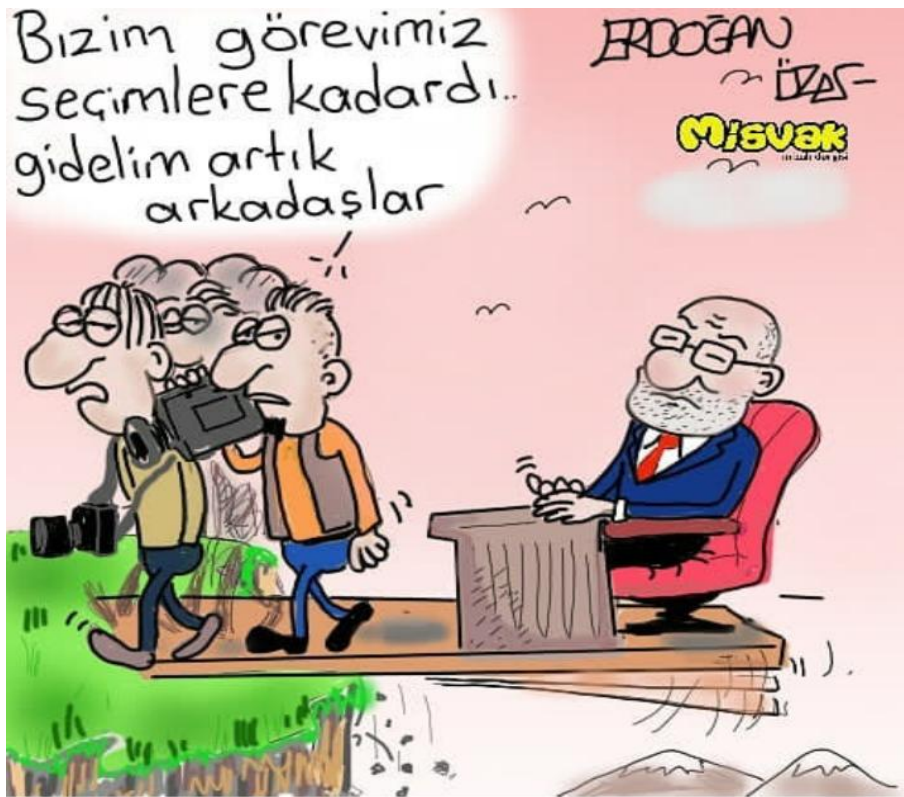
Görsel 3.8. Misvak Dergisi, 14 Haziran 2018 tarihli karikatür

Mizah Kuramlarına göre yorumu: İncelenen karikatür mizahın “uyumsuzluk” kuramıyla bağdaşmaktadır. Genellikle siyasiler “heyecan ve dinamizm” gibi duygularla seçmenlere vaatlerini iletirken burada “öfkeli ve sıkılmış” bir siyasetçi profili karşımıza çıkmaktadır. Dolayısıyla bu durum mizahın “uyumsuzluk” kuramını ortaya koymaktadır.