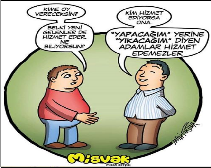
Görsel 3.6. Misvak dergisi, 11 Haziran 2018 tarihli karikatür

Mizah Kuramlarına göre yorumu: İncelenen karikatür mizahın “uyumsuzluk” kuramı çerçevesinde ele alınmıştır. Muharrem İnce’nin Taş Devri dönemine gitmesi, döneme ait giysilerle seçim vaatlerini aktarması olağan bir durum değildir. Karikatürün teması doğrultusunda zıtlıklarla oluşturulan uyumsuzluk, mizahı ortaya koymuştur.