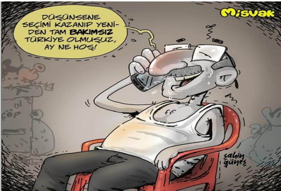
Görsel 3.4. Misvak dergisi, 10 Haziran 2018 tarihli karikatür

Mizah Kuramlarına göre yorumu: İncelenen karikatür mizah kuramlarından “uyumsuzluk” kuramıyla bağdaşmaktadır. CHP Genel Başkanı Kemal Kılıçdaroğlu, çeşitli göstergelerle Taş Devri döneminde tasvir edilmiştir. 24 Haziran 2018 yılında gerçekleşecek olan seçimler dolayısıyla Kılıçdaroğlu’nun seçim vaatleri “çağ dışı” nitelemesiyle aktarılmış, bu doğrultuda zaman ve mekan bağlamında Taş Devri tercih edilerek karikatür teması “uyumsuzluk kuramı” çerçevesinde ele alınmıştır.