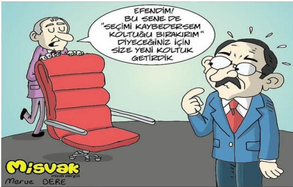
Görsel 3.2. Misvak Dergisi 3 Haziran 2018 Tarihli Karikatür