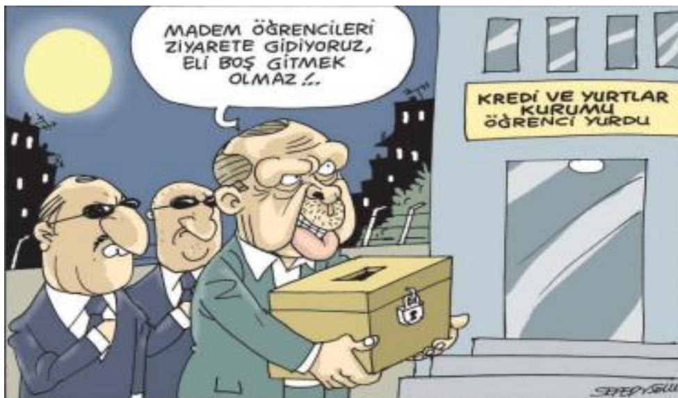
Görsel 3.16. Leman dergisi, Sayı 22, 6 Haziran 2018 tarihli karikatür

Mizah Kuramlarına göre yorumu: İncelenen karikatür mizahın “uyumsuzluk kuramı”na uygun olarak çizilmiştir. İlgili seçim döneminde Muharrem İnce'nin mitinginin Cnn Türk tarafından yayımlanmamasının konu edildiği karikatürde, televizyon binasında yer alan “CNN Fransız” ifadesiyle “uyumsuzluk” kuramı çerçevesinde mizah oluşturulmuştur.