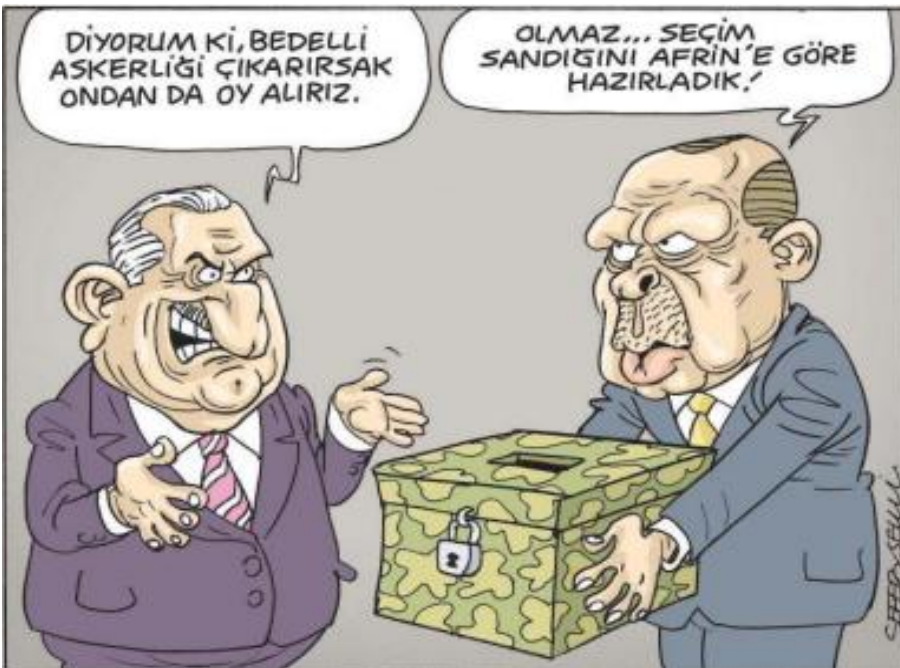
Görsel 3.12. Leman dergisi, Sayı 18, 2 Mayıs 2018 tarihli karikatür

Mizah Kuramlarına göre yorumu: İncelediğimiz karikatür mizahın “üstünlük” ve “uyumsuzluk” kuramına uygun olarak çizilmiştir. 24 Haziran 2018 seçimlerinin kazanacağı düşünülen Kılıçdaroğlu, futbol maçında Erdoğan'a gol atan bir politikacı olarak tasvir edilmiştir. Karikatür bağlamında değerlendirilen mevcut form, Erdoğan'a karşı “üstünlük” vurgusuyla mizahı oluşturmuştur. Futbol maçı, rövaşata ve mağlubiyet unsurlarının seçimle ilişkilendirilmesi ise mizahtaki uyumsuzluğu ortaya koymaktadır.