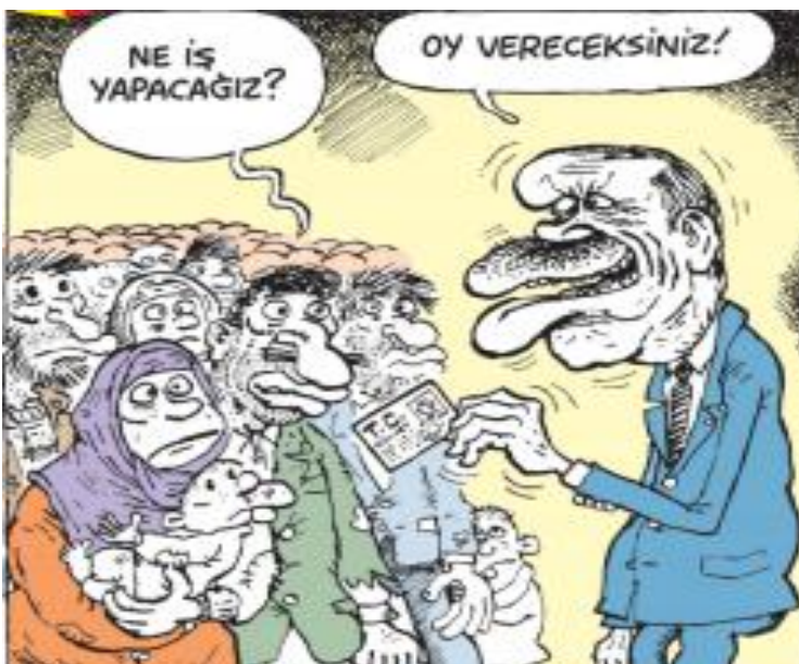
Görsel 3.13. Lemna Dergisi, Sayı 19, 9 Mayıs 2018 tarihli karikatür

Mizah Kuramlarına göre yorumu: İncelediğimiz karikatür mizahın “üstünlük” ve “uyumsuzluk kuramı”na uygun olarak çizilmiştir. 24 Haziran 2018 seçimlerinde başarı sağlamak isteyen Erdoğan ve Yıldırım'ın diyalogu “üstünlük” kuramı bağlamında ele alınmıştır. Karşılıklı iletişimde Yıldırım'ın bir fikir sunması, Erdoğan'ın o fikri doğrudan reddetmesi Erdoğan'ın “üstün” olduğu yaklaşımı çerçevesinde tasvir edilmiştir. Ellerinde görülen askeri desenli sandık, oy almak için düzenlendiği savunulan operasyon ve bedelli askerlik vurgusu ise mizahtaki uyumsuzluğu ortaya koymaktadır.