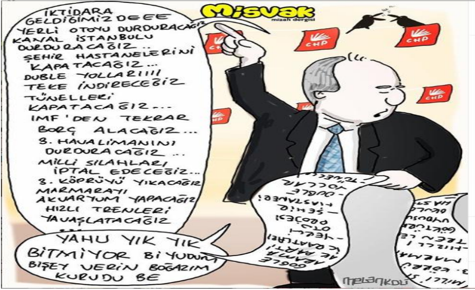
Görsel 3.7. Misvak dergisi, 13 Haziran 2018 tarihli karikatür