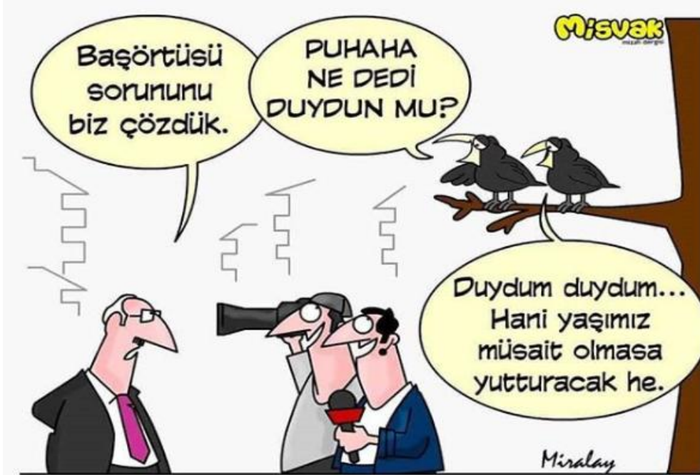
Görsel 3.9. Misvak dergisi, 19 Haziran 2018 tarihli karikatür

koltuğunda oturan bir politikacı yer almaktadır. Gündelik hayatta böyle bir durumun olağan dışı olması ve mantık açısından ortaya konulan ilgisizlik “uyumsuzluk” kuramını oluşturmuştur.