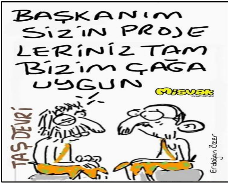
Görsel 3.3. Misvak dergisi, 9 Haziran 2018 tarihli karikatür

Mizah Kuramlarına göre yorumu: İncelenen karikatür, genel anlamda incelendiğinde “uyumsuzluk” kuramıyla bağdaştığı görülmektedir. Karikatürde “seçimleri kaybettiği takdirde makamını bırakma” sözü veren politikacının verdiği sözü yerine getirmemesi, isteksiz bir şekilde getirilen yeni koltuk ile anlatılmış, karikatür teması uyumsuzluk kuramı çerçevesinde ortaya koyulmuştur.