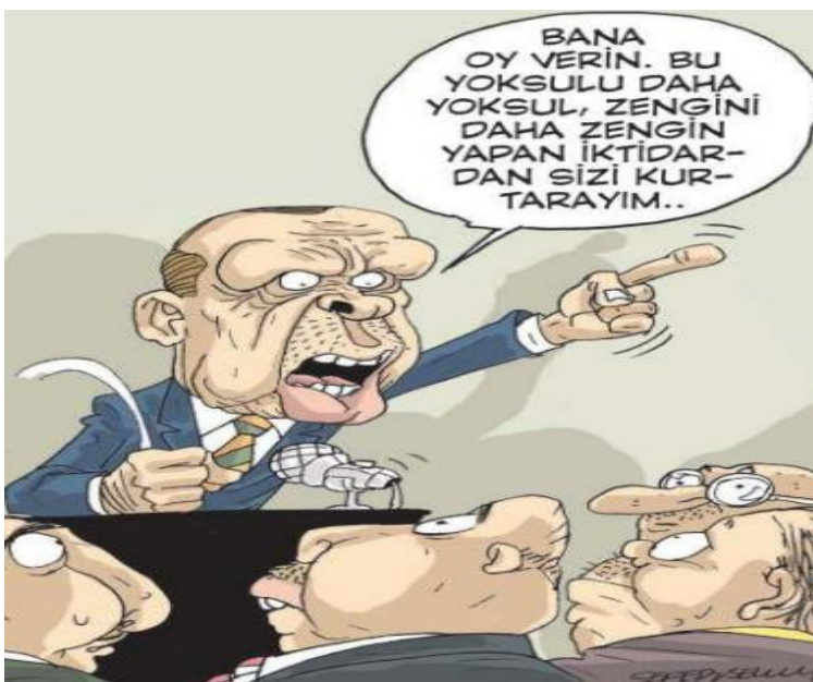
Görsel 3.10. Lemana Dergisi, Sayı 14, 4 Nisan 2018 tarihli karikatür