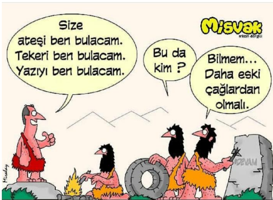
Görsel 3.5. Misvak Dergisi, 10 Haziran 2018 tarihli karikatür

Mizah Kuramlarına göre yorumu: İncelediğimiz karikatür mizahın “uyumsuzluk kuramı”na uygun olarak çizilmiştir. Belediye seçimlerini kazanmaya baş koyan, bunun için çalışan bir siyasi parti liderinin hayali tertemiz şehir sokakları olması gerekirken burada çöplerle dolu kirli sokakların hayali çizilmiş ve bu hayal doğrultusunda ortaya konulan “uyumsuzluk” mizahı oluşturmuştur.