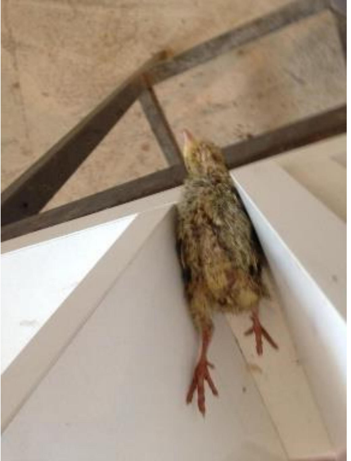
řekil 3.1. Tonik immobilité düzeneğinde test yapılan bir bıldırcının görüntüsü

gerçekleştirilen tonik immobilité ölçümlerine iliřkin bazı görseller 3.1., 3.2. ve 3.3.'te yer almaktadır.