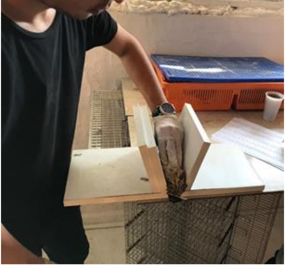
Şekil 3.3. Tonik immobilité testinden bir görünüm

Tüm bıldırcınlar 42 günlük yaşta kesime sevk edilmiştir. Kesim öncesinde 4 saat süre ile yem kaldırılarak, bıldırcınların kesim ağırlıkları belirlenmiştir. Kesim esnasında tüm ağırlık ölçümleri 0.01 g hassasiyetli dijital terazi ile gerçekleştirilmiştir. Kesim, ıslak yolma ve iç açmayı takiben boyun ve karın yağı dâhil, yenilebilir iç organlar hariç olacak şekilde sıcak karkas ağırlıkları saptanmıştır (Yalçın vd. 1995). Bu aşamada abdominal yağ ile yürek, karaciğer ve boş taşlıktan oluşan yenilebilir iç organ ağırlıkları belirlenmiştir. Karkaslar bir gün boyunca +4 °C’de bekletildikten sonra soğuk karkas ağırlığı ölçülerek ve karkaslar parçalanarak göğüs, but, kanat ağırlık ölçümleri gerçekleştirilmiştir.