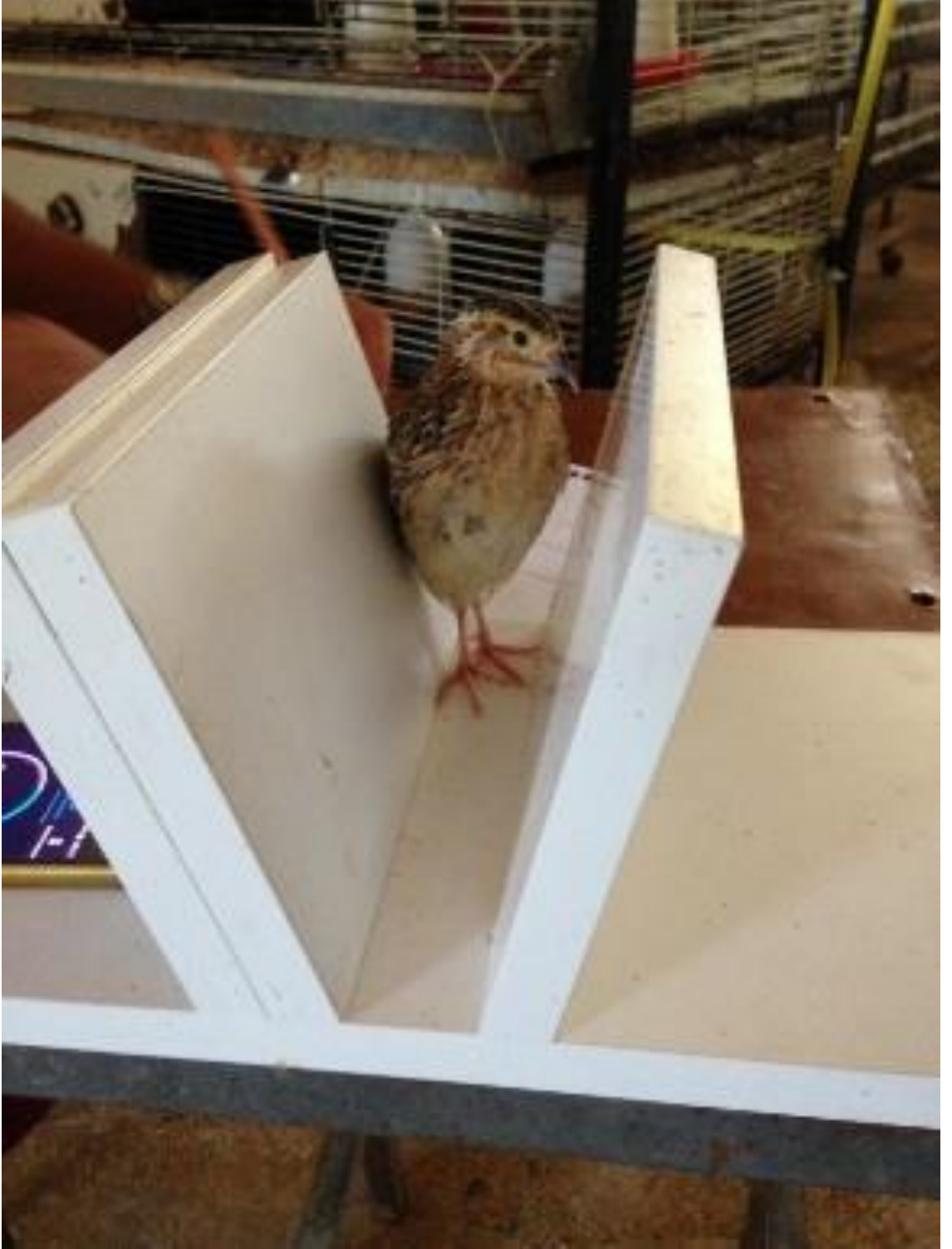
Şekil 3.2. Tonik immobilite düzeneği