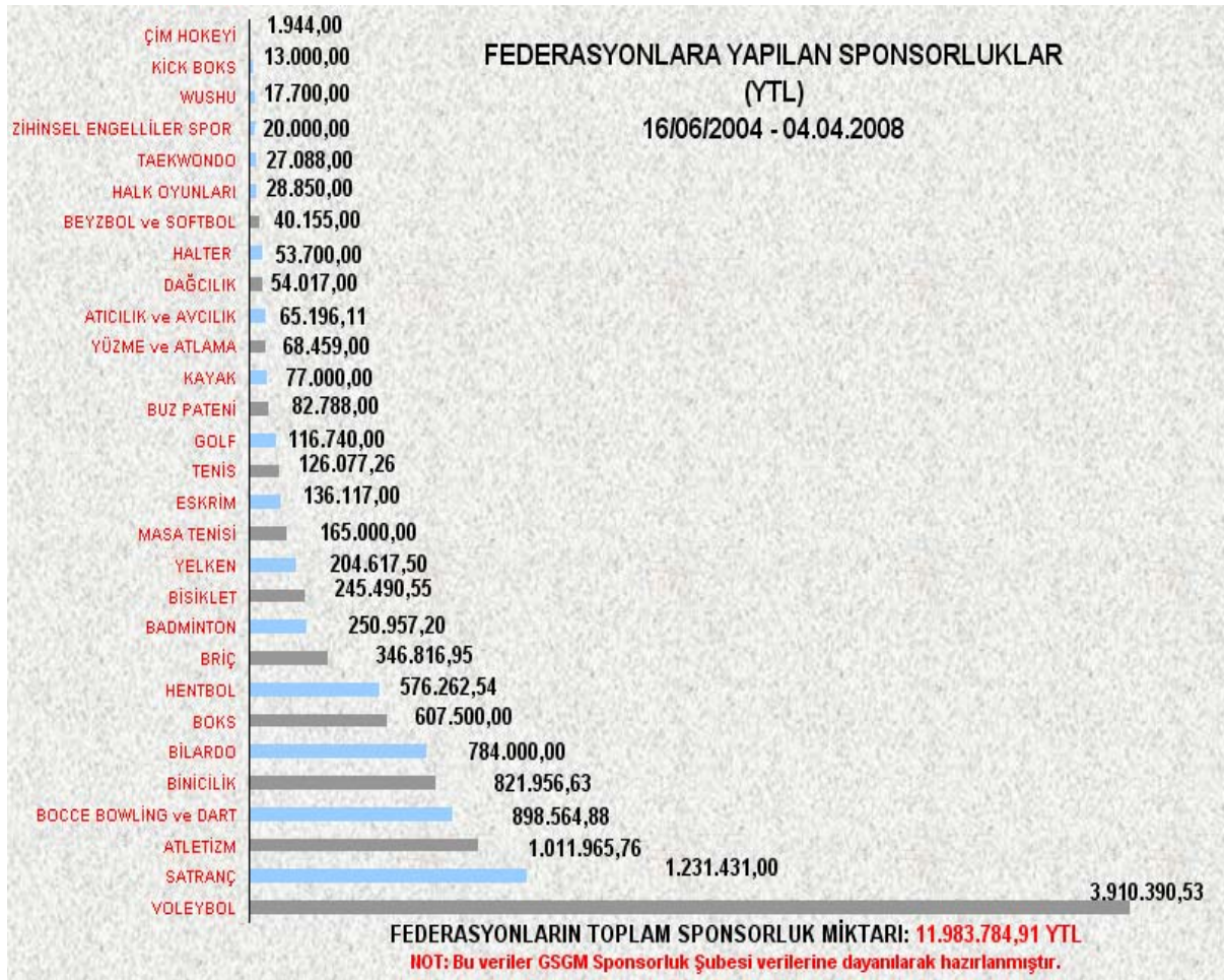
Şekil 5.1. Federasyonlara Yapılan Sponsorluklar(16.06.2004-04.04.2008)