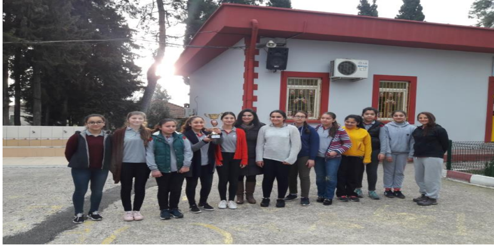
Fotoğraf 4.3.4.21. Dünya Su Günü Kompozisyon Yarışması, İl ve Bölge Birinciliği 2016-2017