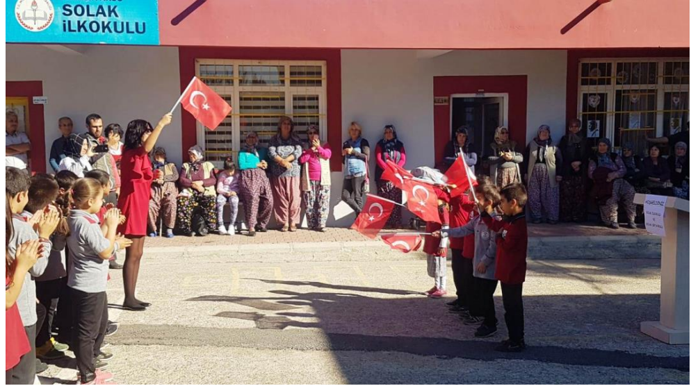
Fotoğraf 4.3.4.15. Tören ve Kutlamalara Öğretmenlerin İstekli Katılımı ve İlgi, Bahçede Bir Öğretmenler Günü Etkinliği, 2018