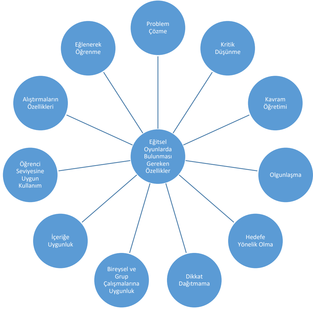
Şekil 1. Eğitsel Oyunlarda Bulunması Gereken Özellikler