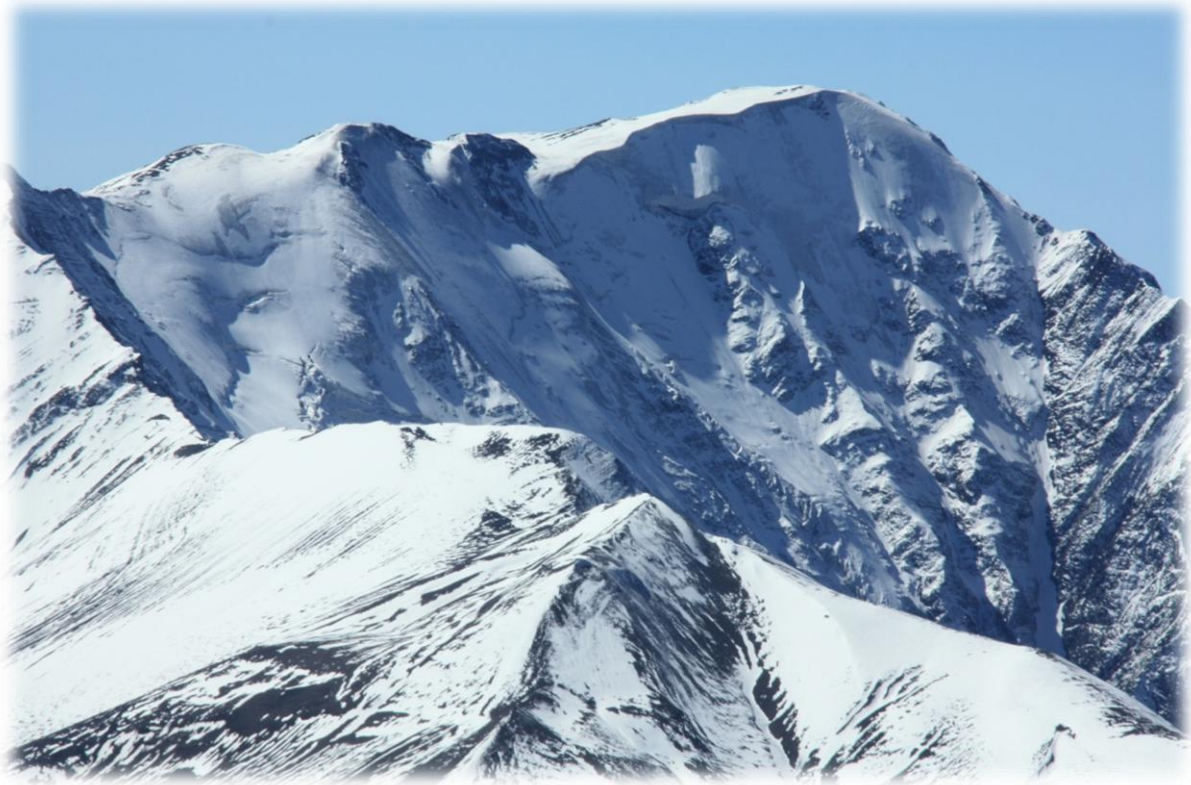
Şekil 3.7 Bazardüzü Zirvesi