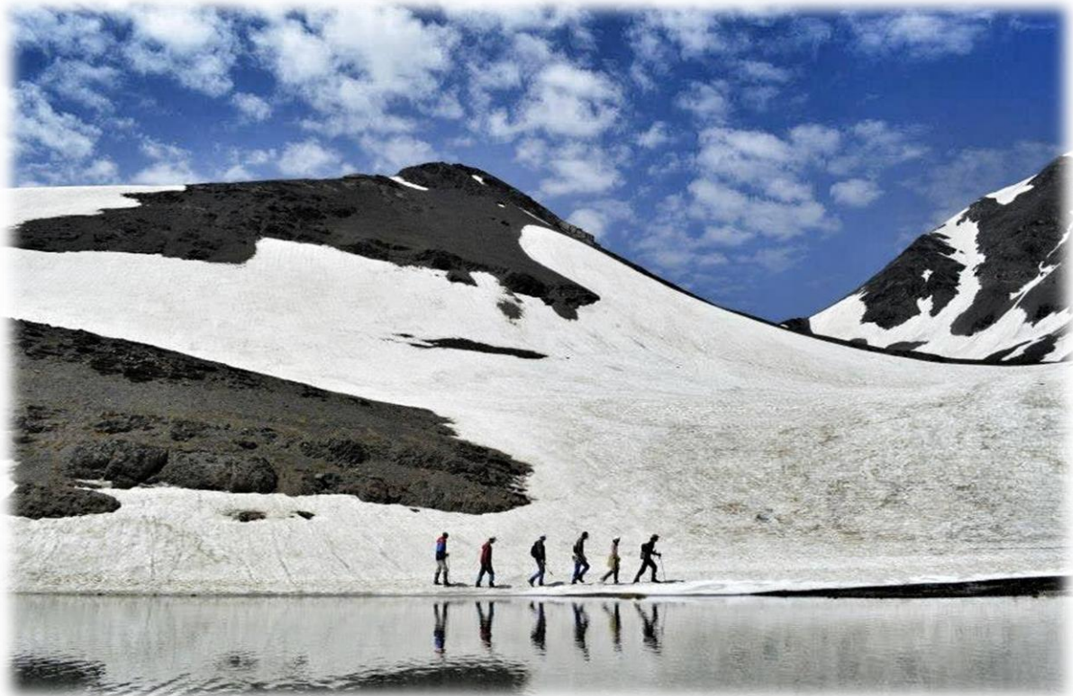
Şekil 3.4 Bazaryurd zirvesi