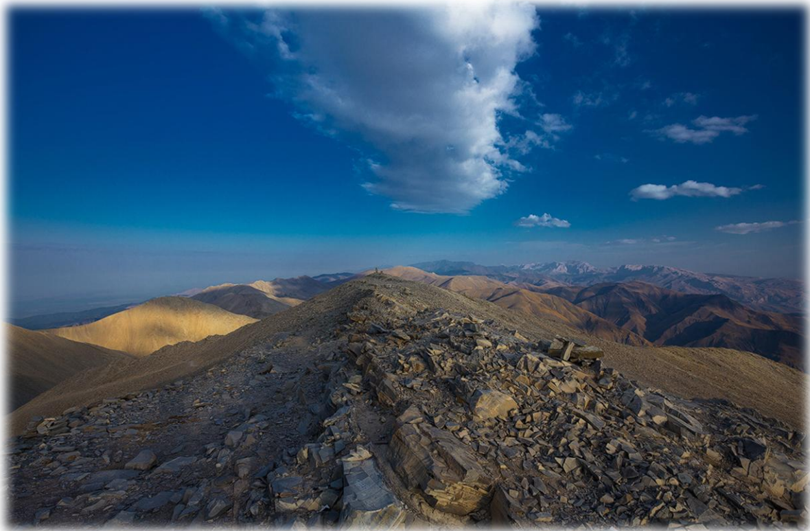
Şekil 3.3 Babadağ zirvesi

Kaynak: https://ru.wikipedia.org , (erişim tarihi: 27.05.2018)