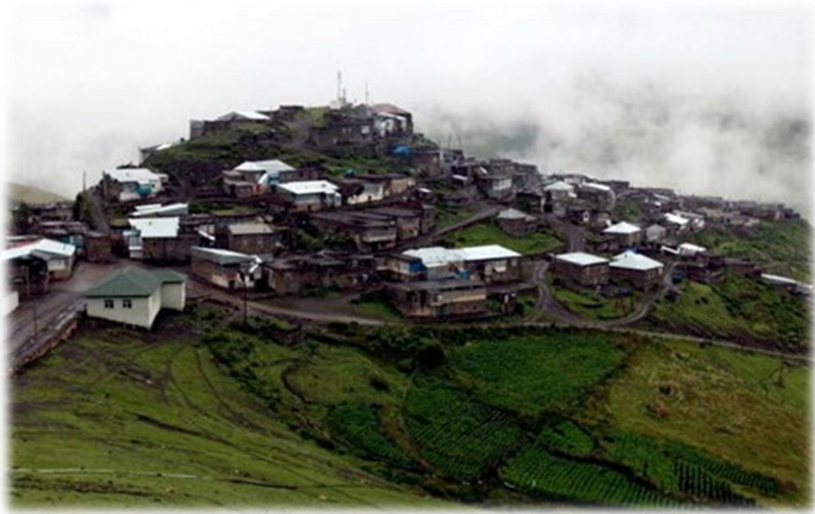
Şekil 3.8 Kinalik Köyü