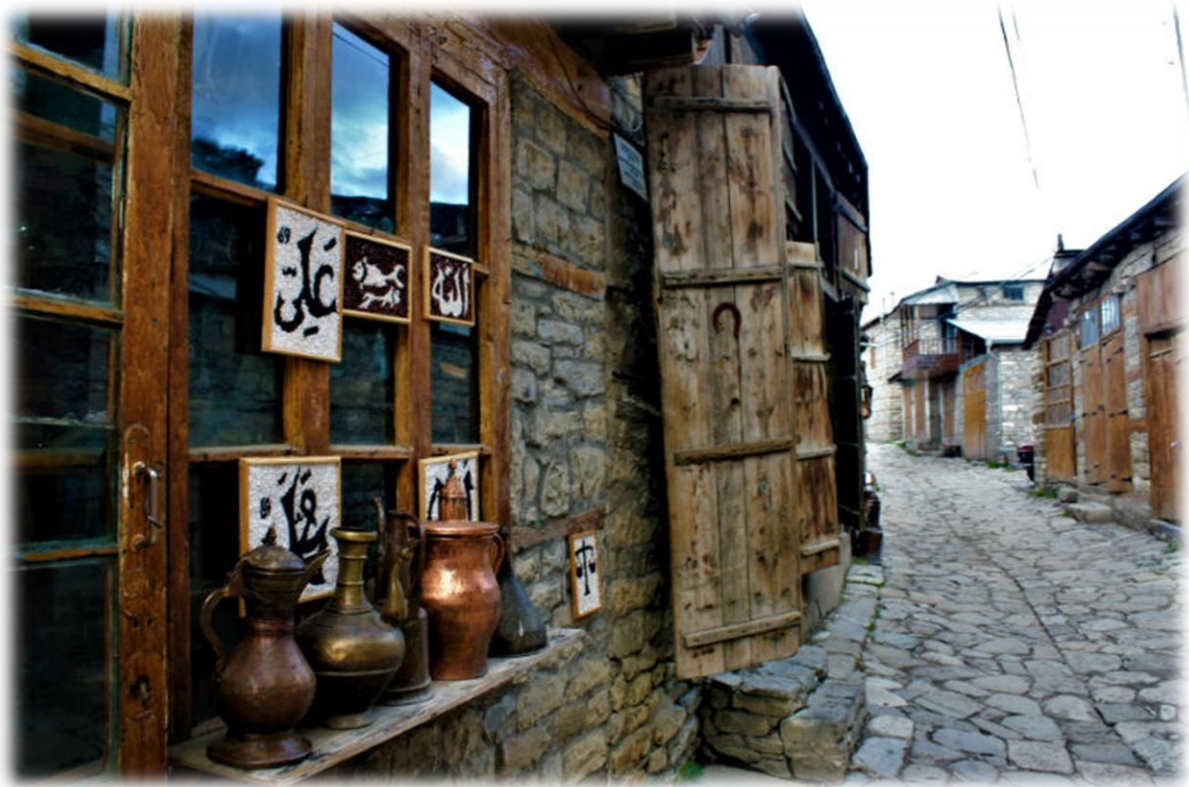
Şekil 3.9 Lahic Kasabası