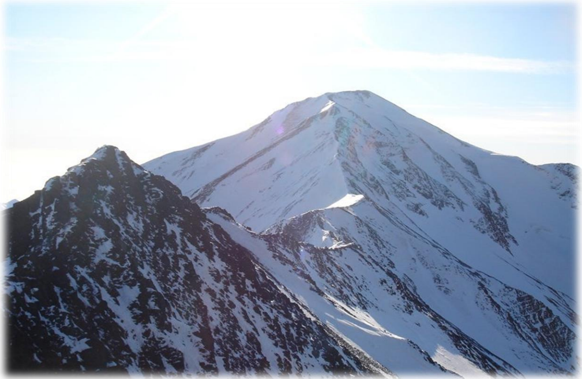
Şekil 3.5 Tufandağ zirvesi