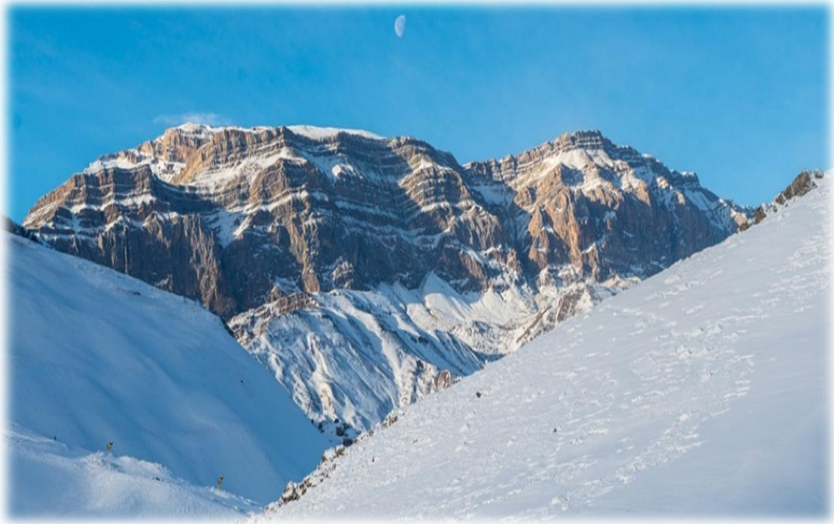
Şekil 3.6 Şahdağ Zirvesi