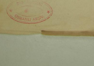
EK 7: Seyf, Nr. 13, 26 Mayıs 1912-15 Mayıs 1328(Rumların Enosis'e Yönelik Faaliyetlerini İçeren Nüsha.

زیر اداره لرتمه بولان افراد اوززنده قواپن موجودی تماماً اجرا ایشمکک زاده کب انتشار ایدن انکازره دولت فحیسی اولدیی حاله بوراده بو کیلر