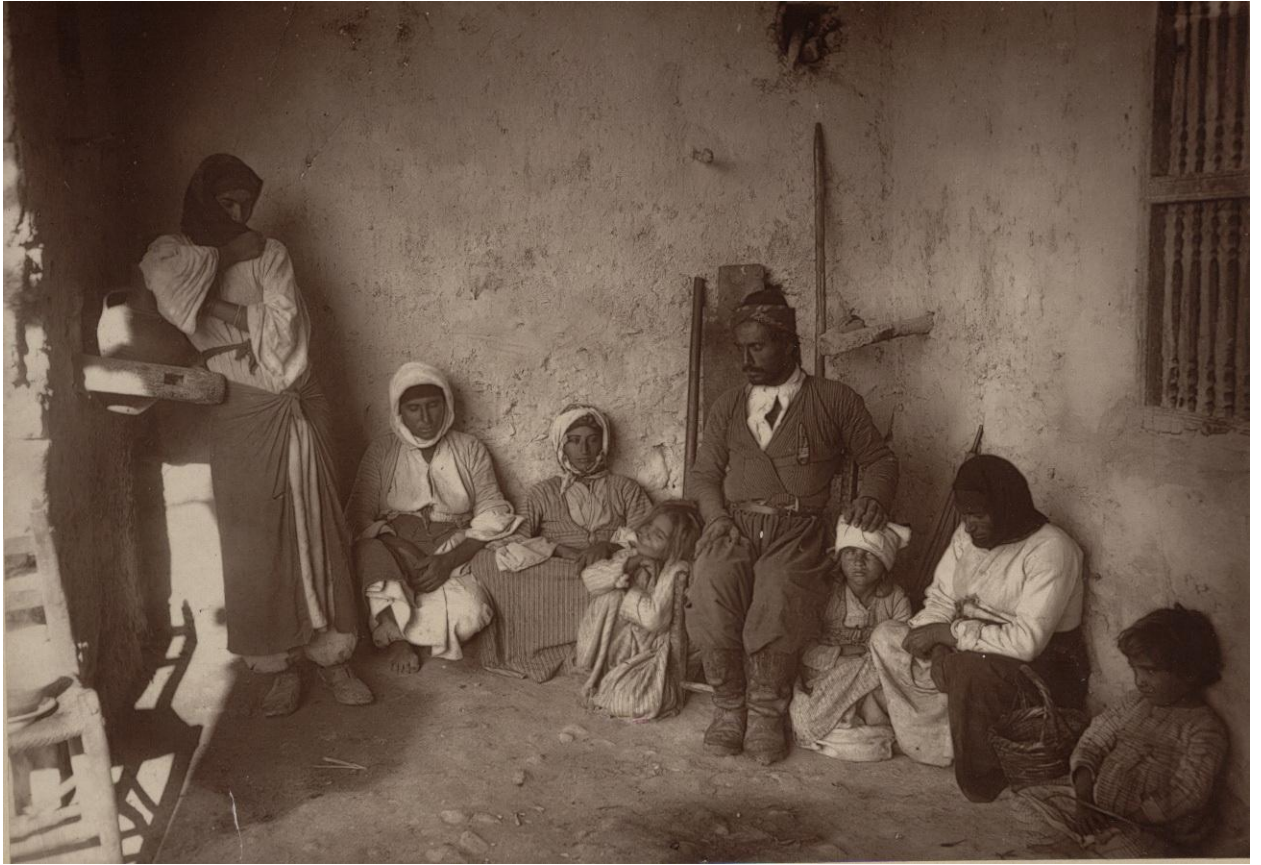
EK 6: John Thomson, With the Camera in the Autumn of 1878 , Vol I, London 1879.