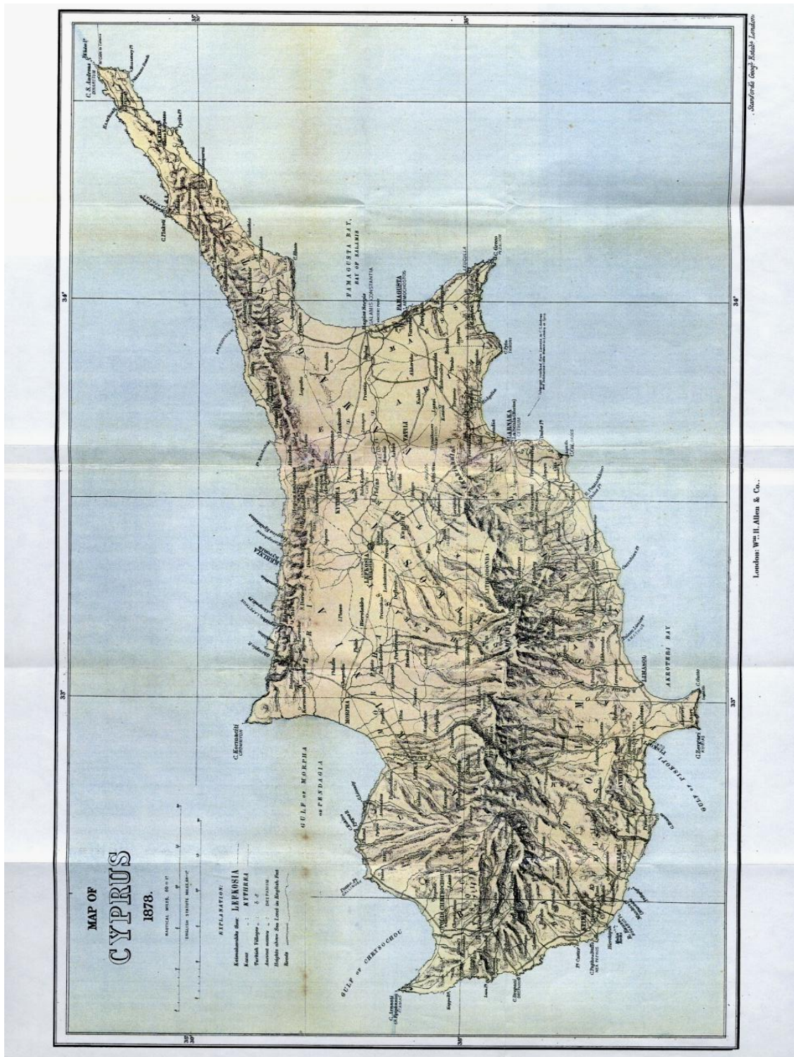
EK 1: Franz Von Löher, Cyprus, Historical and Descriptive (1878).