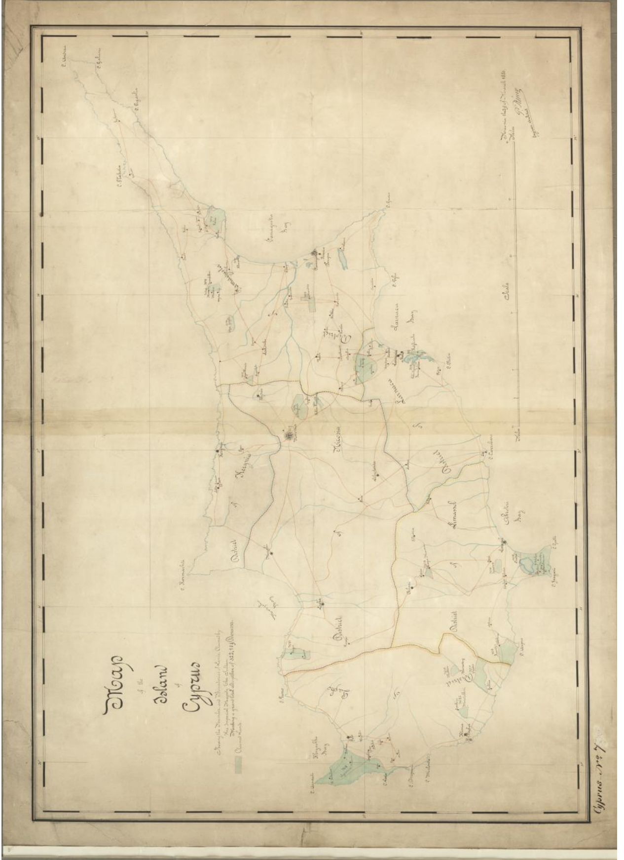
EK 3: N.A., CO., 700 CYPRUS NO 7(Kıbrıs'ta Bulunan Emlâk-ı Hümayun'u Gösteren Harita).