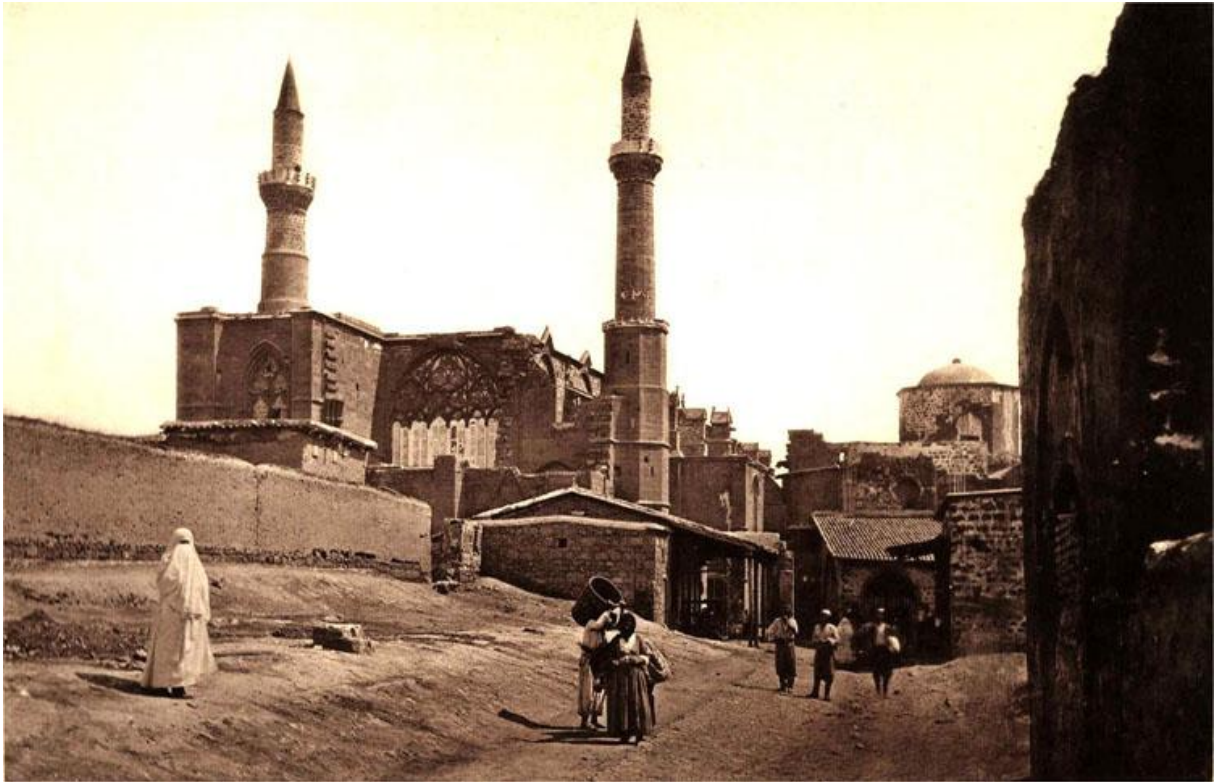
EK 4: John Thomson, With the Camera in the Autumn of 1878 , Vol I, London 1879.