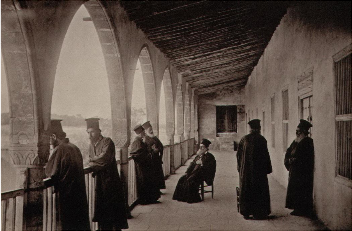
EK 5: John Thomson, With the Camera in the Autumn of 1878 , Vol II, London 1879.