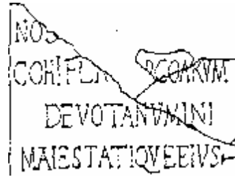
Res. 4: Bosch'un hatalı taslağı, akıbeti bilinmeyen parça ile birlikte yazıtın alt kısmı.

Yayın yeri: Bosch, Inscr. von Side, nr.8 (çizim ile birlikte); Bean, Inscr. of Side, nr. 105, res. 17 (AE 1966, nr. 459); Nollé, I.v.Side I, nr. 42 ve lev. 40a.