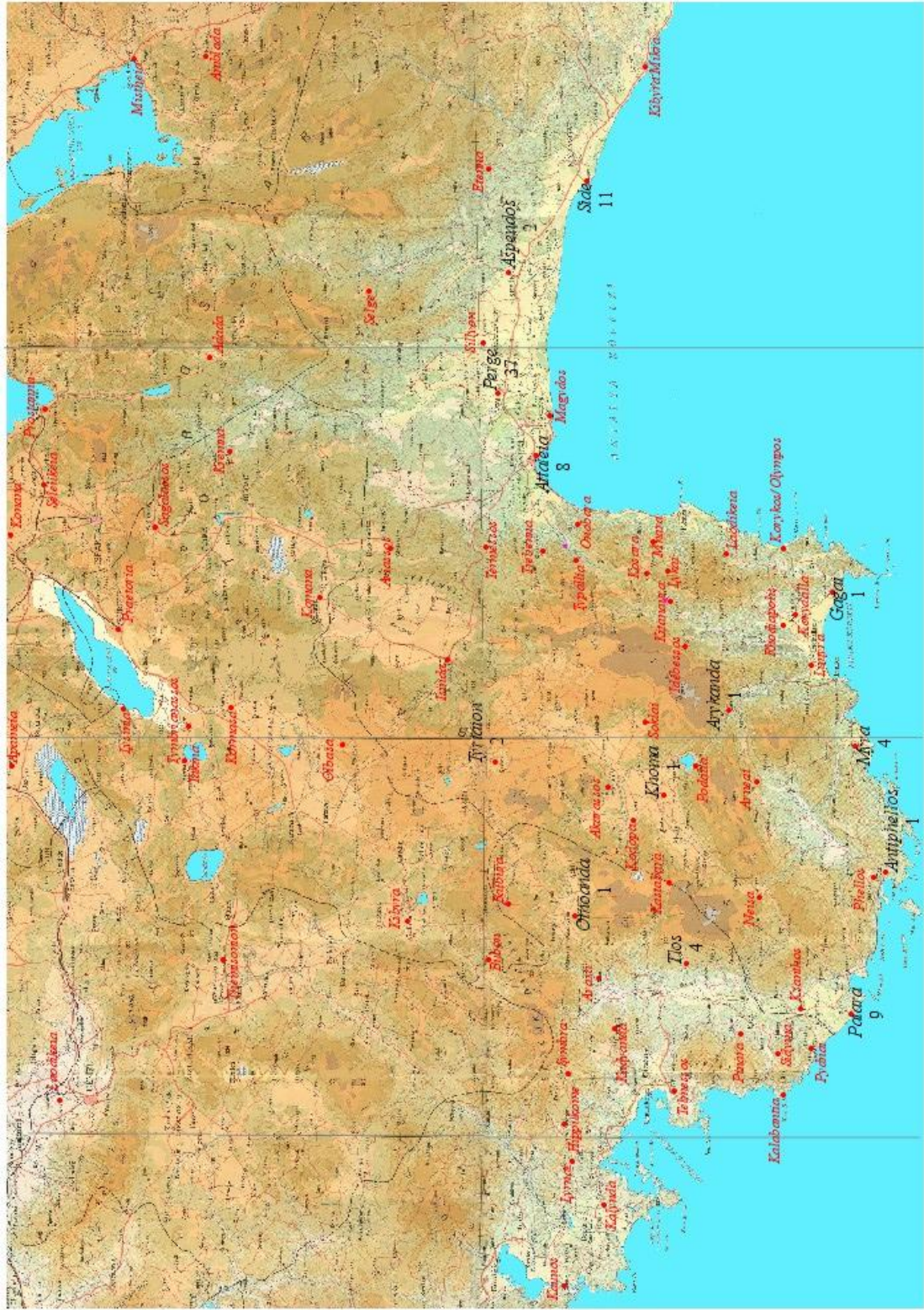
Harita 1: Lykia ve Pamphylia'da Latince ve Yunanca çift dilli yazıtların kentlere göre dağılımı.