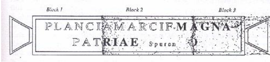
Res. 2: Latince yazıtın çizimi (Şahin, I.v.Perge I, s. 119)

(a) Üç bloktan oluşan tabula ansata içinde Latince yazıt. Yazıtın sol kısmını oluşturan blok yitik. Orta blok ve tabula ansata içeren sağ blok üç kemerli kapının orta kemerinin dış tarafında yerde bulunmuş. Orta blok üzerindeki yazıtın büyük kısmı başka bir blok tarafından kapatılmış. Yazıt üzerindeki dübel delikleri metal harflerden oluştuğunu gösteriyor.